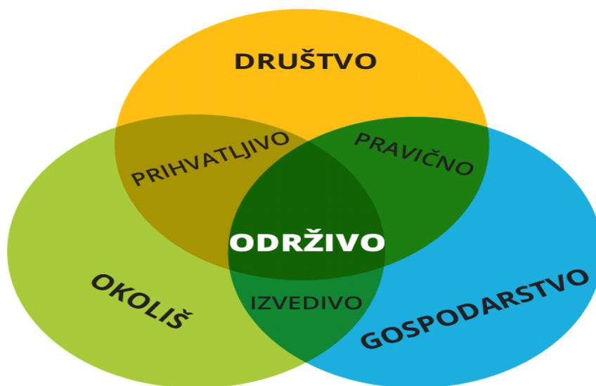
Shema 1: Temeljne odrednice održivog razvoja

Definicije održivog razvoja mijenjale su se kroz povijest ali je bit ostala ista. Održivi razvoj teži postizanju ravnoteže između tri sastavnice: društva, okoliša i gospodarstva.