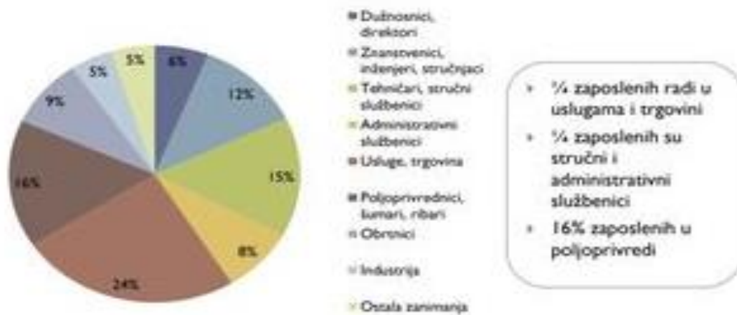
Dijagram broj 2: Struktura zaposlenih po djelatnostima u gradu Korčuli