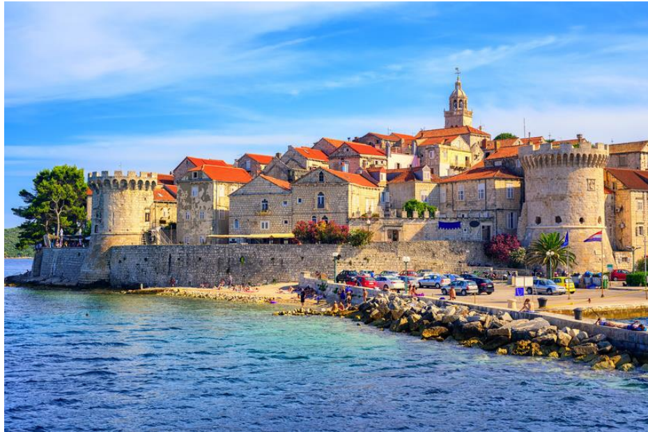
Slika 1: Grad Korčula