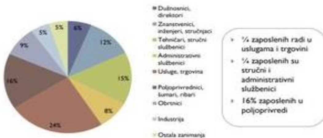
Dijagram broj 2: Struktura zaposlenih po djelatnostima u gradu Korčuli