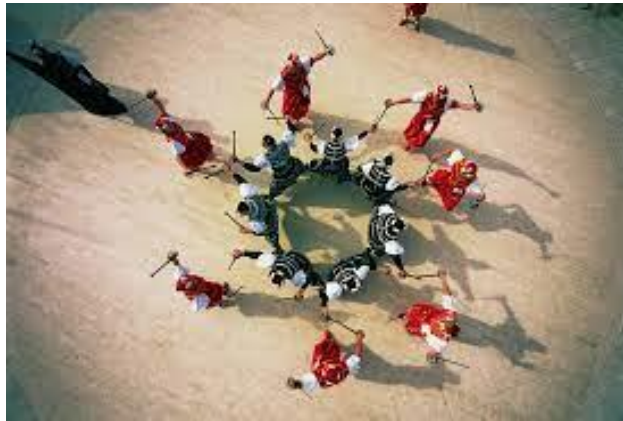
Slika 2: Moreška

Kumpanija ili ples od boja je ples koji se izvodi s mačevima u mjestima Žrnovo, Pupnat, Čara, Blato i Vela Luka. Ples od boja izvodi se od 16. stoljeća sa skupinom barjaktara altira i izvođača kumpanjola. Kapitan predvodi formacije lančanog plesa u kojem svaki izvođač drži vrh mača susjednog kumpanjola. Kumpanjoli žustrim pokretima mača pokazuju svoje vještine. Ples se izvodi uz pratnju mišnjica i bubnjeva