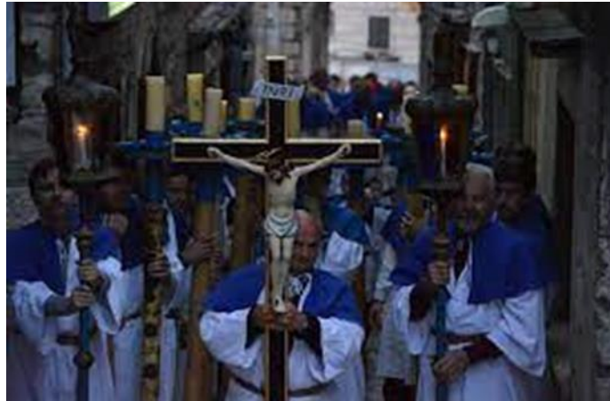
Slika 3: Procesija na Korčuli