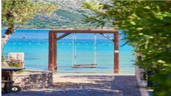
Slika 4: Plaža La'Banya

Zbog poznate ljuljačke, plaža je postala jedna od najpopularnijih u županiji i mnogi mladi je posjećuju samo zbog fotografiranja.