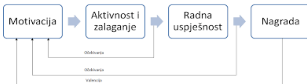
Slika 3- Proces motivacije prema sadržajnim teorijama