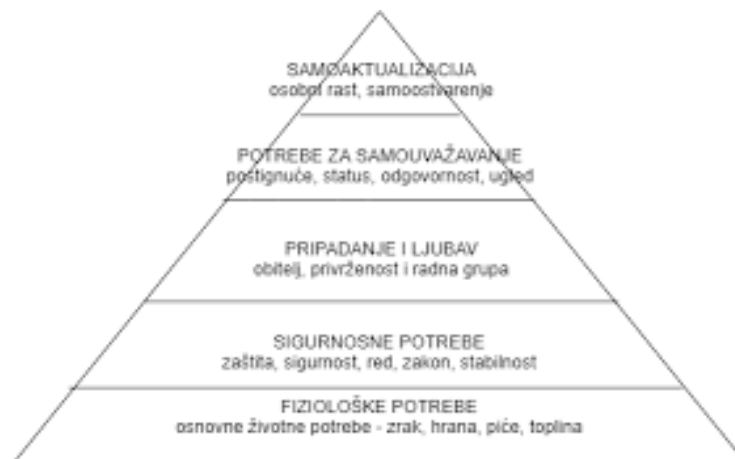
Slika 2- Piramida potreba (Jandrić, Samardžija, Obradović, 2015)

Polazeći od koncepcije čovjeka kao integrirane jedinice i organizirane cjeline, on smatra da se proučavanje motivacije mora usmjeriti na krajnje ciljeve, želje ili potrebe ljudi. Jednako tako smatra da postoje određene strukture temeljnih potreba koje su univerzalne. 5 Pojavom određene potrebe dolazi do zadovoljenja iste koje je uvjetovano zadovoljenjem prethodno nastale potrebe. Potreba kronološki nastala prije hijerarhijski je važnija potreba. Potrebe su svrstane piramidalno na pet razina počevši od fizioloških potreba, zatim potrebe za sigurnošću, potrebe za poštovanjem te u samom vrhu stoji potvrda za samopotvrđivanje.