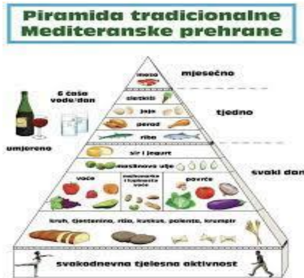
Slika 2. Piramida pravilne prehrane

tjelesne aktivnosti i odmora koji su u jednakom omjeru bitni za naše tijelo kao i pravilna prehrana. Uz svakodnevnu tjelesnu aktivnost u prakticiranju mediteranske prehrane nam pomaže piramida tradicionalne mediteranske prehrane.