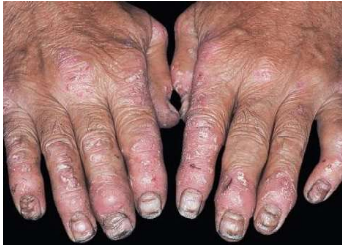
Slika 3. Psoriasis arthropathica – psorijatični artritis

Psorijaza noktiju ( Psoriasis unguium ) može nalikovati na gljivičnu infekciju nokta. Nokti zahvaćeni psorijazom u početku imaju karakteristične punktiformne (točkaste) udubine i izgledaju kao da su izbodeni iglom. Javlja se brazdanje, udubljivanje, pucanje i zadebljanje noktiju.