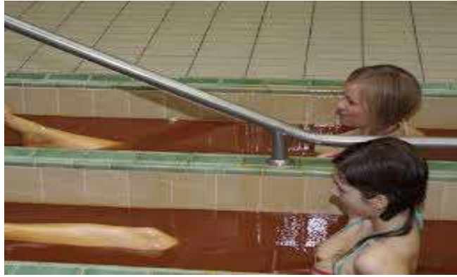
Slika 6. Liječenje oboljelih u Specijalnoj bolnici Naftalan u Ivanić gradu