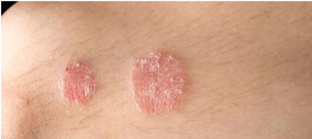
Slika 1. Tipičan psorijatični plak prekriven srebrenkastim ljuskama

Psorijaza (grč. psora = ljuska) je kronična upalna bolest kože obilježena pojavom oštro ograničenih crvenkastih ploča prekrivenih srebrno bijelim ljuskama. Osim kože, bolest redovito zahvaća vlasište i nokte, a u pojedinih bolesnika i zglobove u vidu psorijatičnog artritisa 4 .