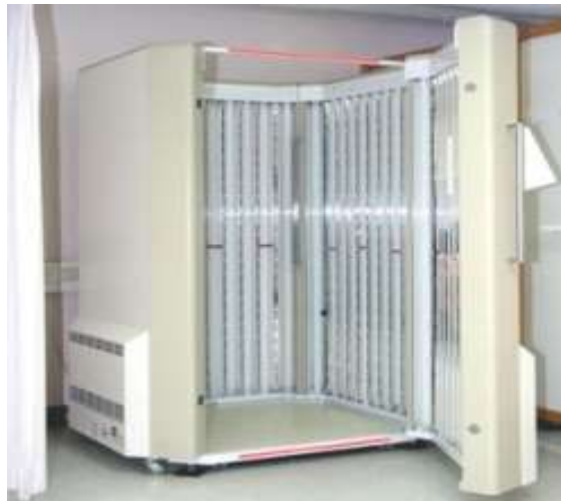
Slika 7. Kabina za provođenje fototerapije

U težih oblika psorijaze s jače infiltriranim žarištima i zahvaćenošću kože više od 30% površine indicirana je fotokemoterapija (PUVA). Naziv PUVA terapija označuje primjenu fotosenzibilizirajućih tvari psoralena (P) i UVA zračenja. PUVA dovodi do remisije psorijaze ponavljanim, kontroliranim fototoksičnim reakcijama uzrokovanim fotosenzibilizirajućom tvari i UVA-zračenjem. Fotosenzibilizatori su psoraleni koji se mogu primijeniti peroralno, sistemno ili lokalno u obliku kupke, kao i lokalno u obliku otopine. Peroralna PUVA terapija - praktično se provodi tako da bolesnik uzima tablete 8-metoksipsoralena u dozi od 0,6 mg/kg/tjelesne težine i nakon 2 sata se obasjava UVA zrakama. PUVA kupke - praktično se provode tako da je bolesnik dvadeset minuta u toploj vodi (37 °C) koja sadržava 1 mg/ L 8-metoksipsoralena te se odmah nakon kupke obasjava UVA zrakama. Prednosti su manje ukupne doze zračenja koje bolesnik primi tijekom terapije, odsutnost gastrointestinalnih simptoma (mučnina i povraćanje) i mogućeg utjecaja na jetru, kao i činjenica što nema potrebe za nošenjem zaštitnih naočala nakon obasjavanja jer nema sistemske fotosenzibilizacije. Zbog bolje djelotvornosti PUVA terapija se kombinira s različitim lokalnim i sistemnim lijekovima, a najčešće s oralnim retinoidima kao Re-PUVA terapije 1,14 .