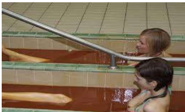
Slika 6. Liječenje oboljelih u Specijalnoj bolnici Naftalan u Ivanić gradu