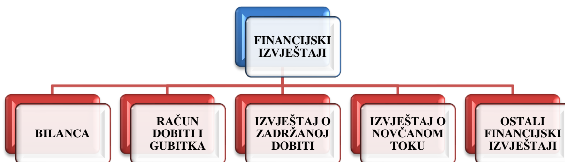
Slika 1. Vrste financijskih izvještaja

Najveći broj korisnih podataka o poslovanju neke banke može se pronaći u njenim financijskim izvještajima, pri čemu se kao osnovni zadatak računovodstva smatra prikupiti i analizirati te objaviti financijske podatke u elektronskom/tiskanom obliku kako bi svi zainteresirani mogli do njih lako doći. U tom je smislu cilj financijskog izvještavanja upravo pružanje ključnih podataka zainteresiranim korisnicima o financijskom položaju banke i (ne)uspješnosti poslovanja (Žager & Žager, 1999, str. 33).