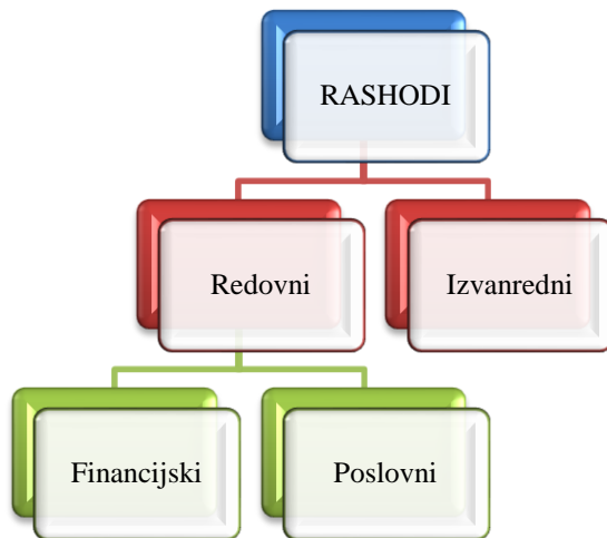
Slika 3. Podjela rashoda