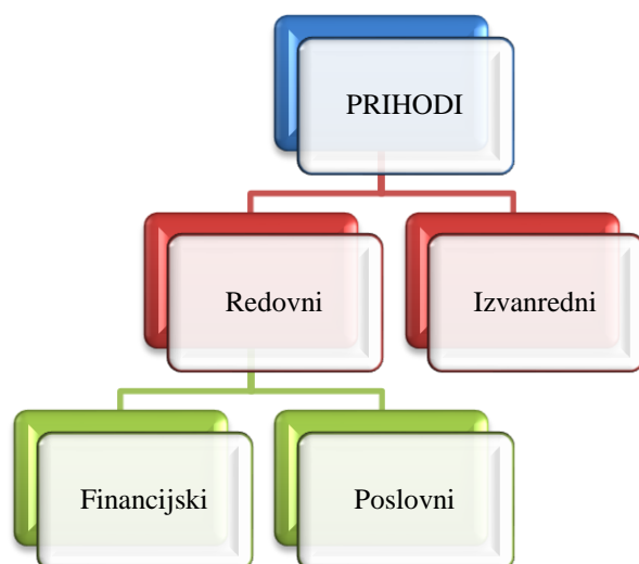
Slika 2. Podjela prihoda

prikazuje kako se prihodi dijele s obzirom na činjenicu da se mogu javljati redovito i povremeno (Žager & Žager, 1999, str. 47).