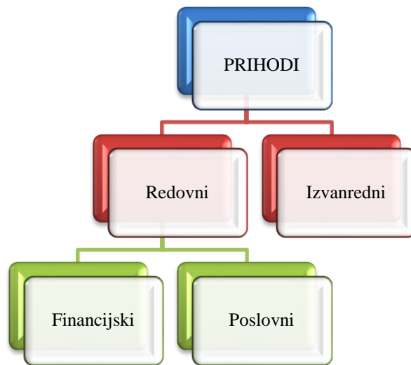
Slika 2. Podjela prihoda

prikazuje kako se prihodi dijele s obzirom na činjenicu da se mogu javljati redovito i povremeno (Žager & Žager, 1999, str. 47).