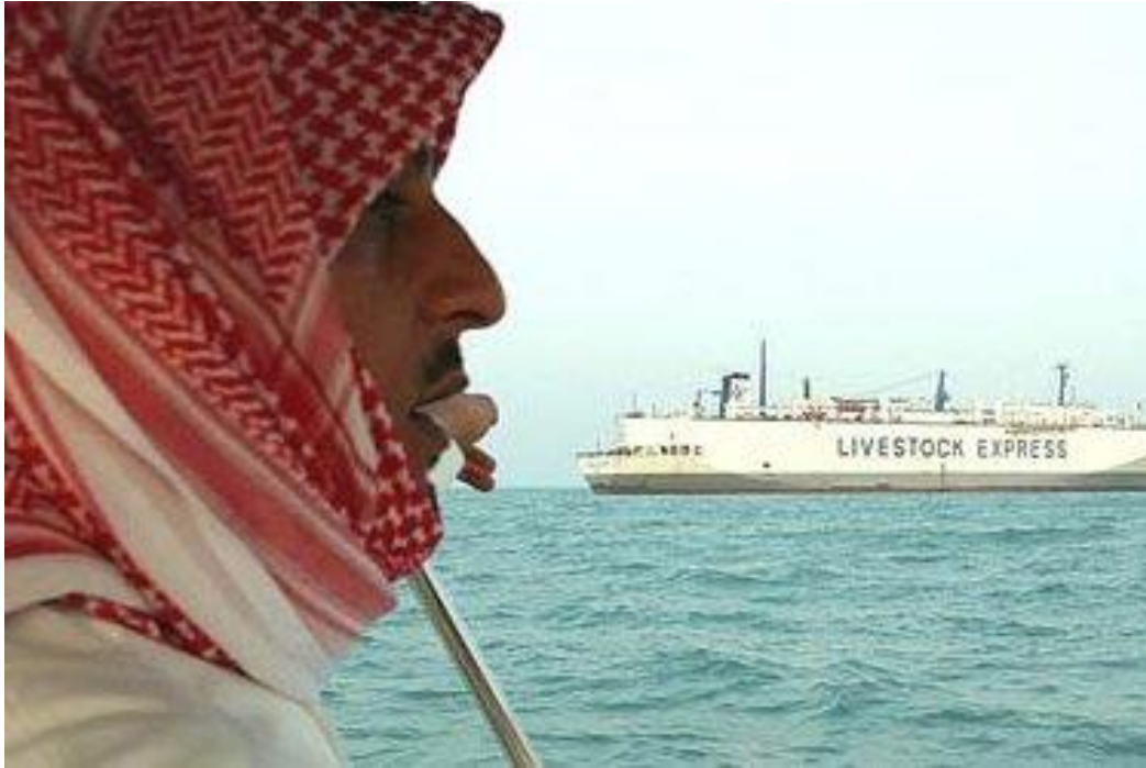
Slika 3. M/V Cormo Express

http://www.abc.net.au/cm/rimage/1488182-3x2-medium.jpg?v=4