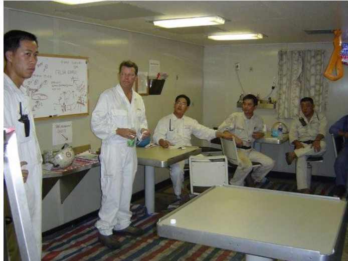
Slika 2. Sastanak posade prilikom izrade procjene rizika