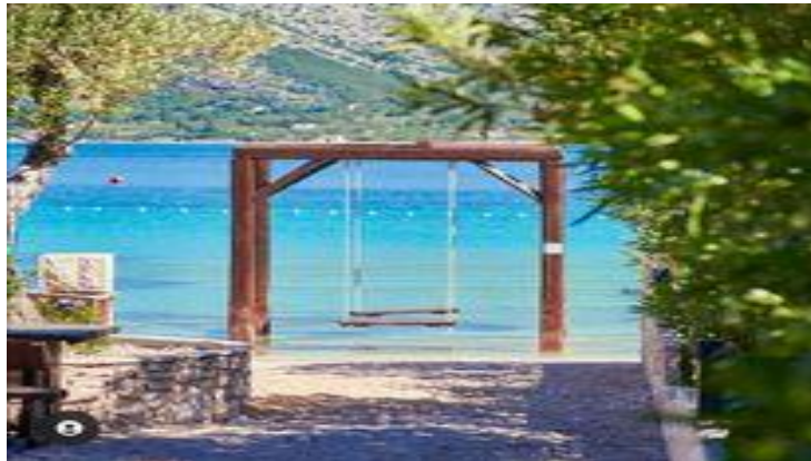
Slika 4: Plaža La'Banya

Zbog poznate ljuljačke, plaža je postala jedna od najpopularnijih u županiji i mnogi mladi je posjećuju samo zbog fotografiranja.