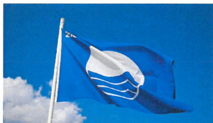
Slika 5. – Plava zastava, označava čistoću i sigurnost

Najstarija marina na cijeloj istočnoj obali Jadrana – Marina Puntarica, ujedno je i jedna od najpopularnijih hrvatskih marina. Rodila se iz brodogradilišta koje je osnovano davne 1922. te je i dan danas moguće obaviti remont na jahti. Više je puta proglašavana najboljom hrvatskom marinom, što pokazuju brojne nagrade, certifikati te priznanje ‘Plava zastava’.