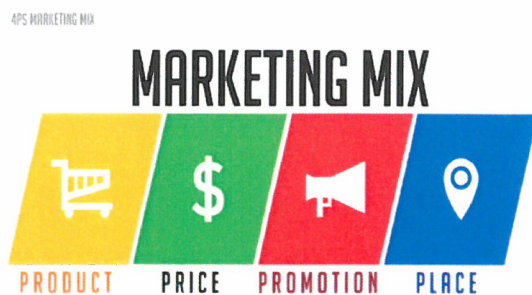
Slika 8. – koncept marketinškog miksa

Marketinški mix predstavlja način kako ostvariti željene ciljeve. Često se naziva i 4P zbog toga što se sastoji od 4 varijable s početnim slovom “P” u engleskom jeziku;