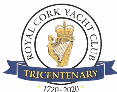
Slika 2. – Royal Cork Yacht Club

Jahta je dobila naziv prema nizozemskoj riječi 'yacht' što bi u prijevodu značilo 'lov'. To je označavalo regate s malim brodicama po nizozemskim kanalima još u 16. stoljeću. U Velikoj Britaniji je započeo razvoj yachtinga u 17. i 18. stoljeću, a prvo sportsko jedriličarsko društvo imena Royal Cork Yacht Club osnovan je u Corku u Irskoj 1720. Suvremeni način odvijanja nautičkog turizma pojavio se u 19. stoljeću, a prve marine pojavile su se sredinom 20. stoljeća popularizacijom jahti.