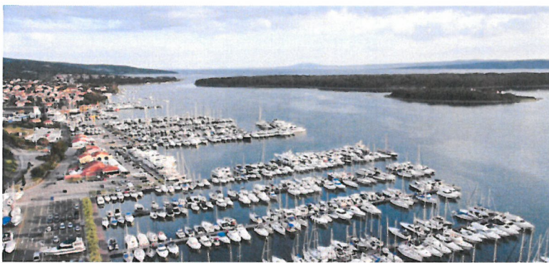
Slika 4. – Pogled na marinu u Puntu

Najstarija marina na cijeloj istočnoj obali Jadrana – Marina Puntarica, ujedno je i jedna od najpopularnijih hrvatskih marina. Rodila se iz brodogradilišta koje je osnovano davne 1922. te je i dan danas moguće obaviti remont na jahti. Više je puta proglašavana najboljom hrvatskom marinom, što pokazuju brojne nagrade, certifikati te priznanje ‘Plava zastava’.