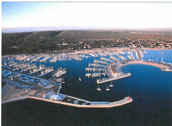
Slika 3. – Pogled na marinu 'Dalmacija'

Marina 'Dalmacija' je u vlasništvu tvrtke D-Marin. Tvrtka je osnovana 2003. godine u Turskoj i danas je vlasnik 15 marina u Hrvatskoj, Crnoj Gori, Turskoj, Ujedinjenim Arapskim Emiratima i Grčkoj. Osim marine 'Dalmacija', oni su vlasnici marina u Tribunju, Zadru (Borik) te Šibeniku (Mandalina).