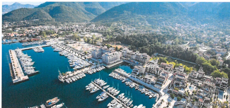
Slika 7. – Marina Porto Montenegro u Tivtu

Marina je počela s radom 2009. godine. Na samom početku imala je 85 vezova, tokom godina ih se izgradilo još da bi se došlo do današnje brojke od 456. Cilj ih je izgraditi još i više te doći do 850 vezova.