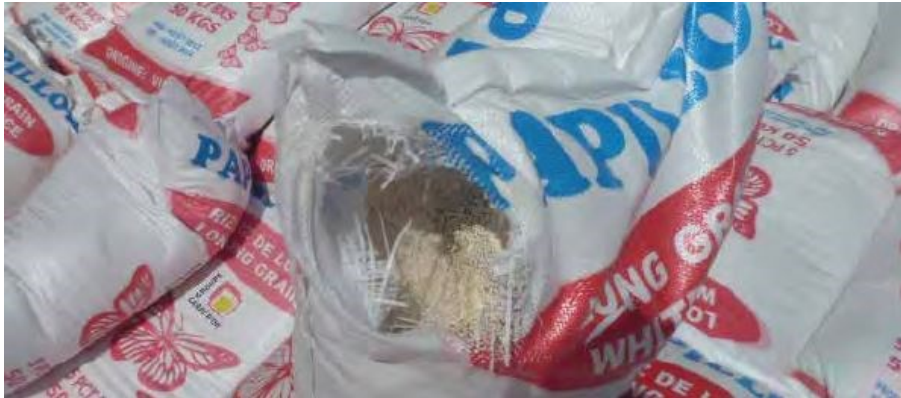
Slika 11. Poderana vreća riže.

prateću dokumentaciju za časničku potvrdu ( mate's receipt ). U slučaju oštećenja, časnička potvrda treba biti izdana s relevantnim napomenama koje odražavaju količinu i vrstu pronađene štete. Na primjer, „dvije poderane vreće“ (slika 11.), „pet vreća s promijenjenom bojom“, „tri pljesnive vreće“ ili „četiri pošiljke blago/umjereno/jako zaražene živim štetočinama“ [2].