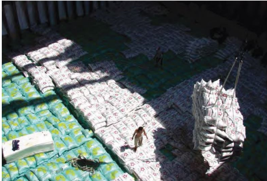
Slika 6. Prikaz ventilacijskih kanala prilikom ukrcaja riže.

u temperaturi okolnog zraka i morske vode prilikom putovanja mogu dovesti do stvaranja kondenzacije, a za terete u vrećama potrebno je osigurati odgovarajuće ventilacijske kanale unutar skladišta tijekom utovara (slika 6.). Mjesto i broj ovih kanala bit će određeni uputama za prijevoz [7].