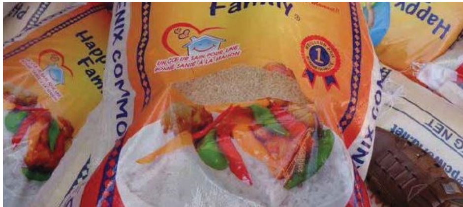
Slika 15. Rasparana vreća riže znak je sitne krađe prilikom rukovanja teretom.