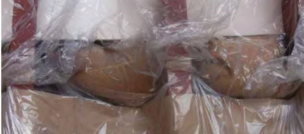
Slika 4. Piljevina u vrećama umetnuta na prijelazu između bočne oplata i donjeg bočnog tanka.