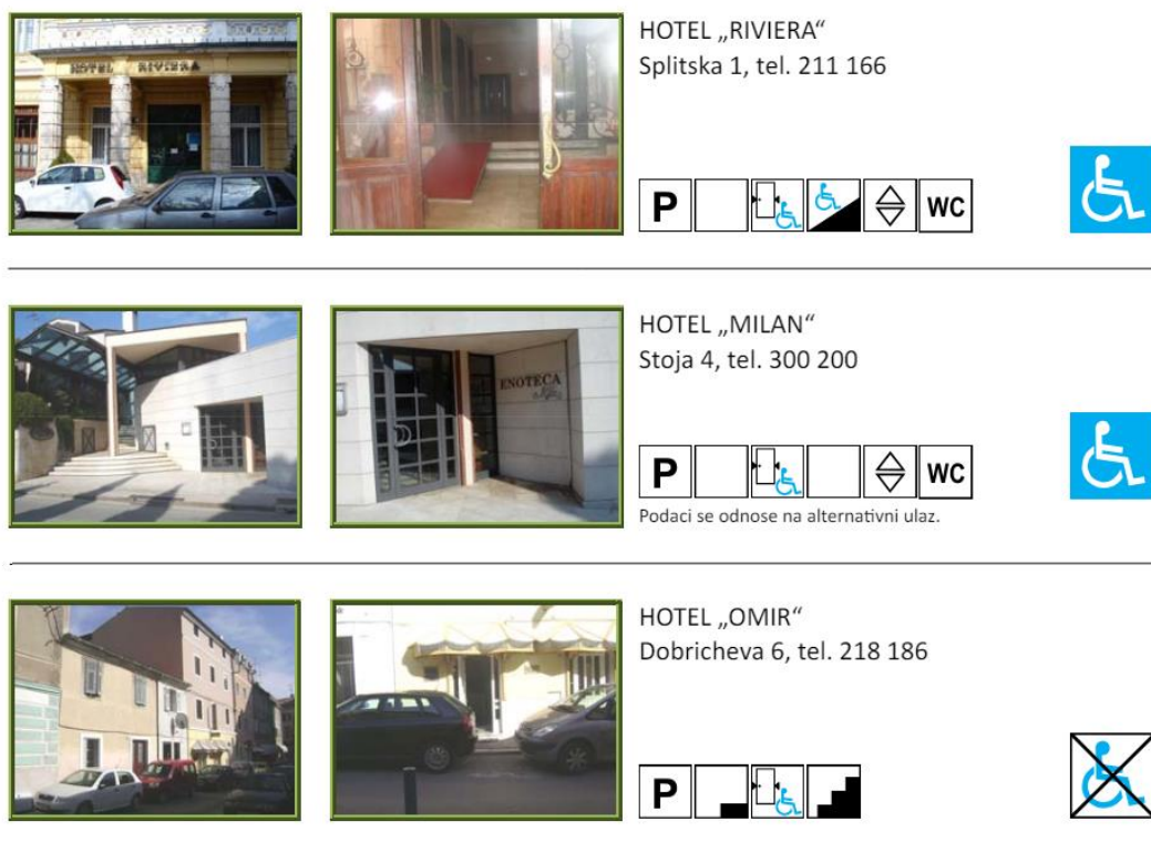
Slika 1. Vodič za osobe s invaliditetom kroz Istarsku županiju - Pula - ugostiteljstvo

Kao primjer dobre prakse može se navesti Istarska županija koja je u suradnji sa Zajednicom saveza osoba s invaliditetom (SOIH) objavila vodič za osobe s invaliditetom kroz Istarsku županiju. Vodič je pokrenut 2012., a njegov cilj je stvaranje okruženja gdje će se svi osjećati ugodno i slobodno kretati. Velika pozornost navedenog vodiča posvećena je okolišu te će poslužiti podizanju svijesti šire javnosti o potrebi prilagođavanja okoliša, a ujedno je namijenjen i turističkim agencijama koje imaju sve više zahtjeva od osoba s invaliditetom kao turističkih posjetitelja. Istarska županija na ovaj način želi pokazati turistima, ali i svojim građanima, da kao jedna uspješna i prepoznata turistička destinacija u svijetu mora pratiti trendove na tržištu i tako se i dalje razvijati u skladu s navedenim potrebama (Mirić i Džanić, 2012.). U vodiču su analizirani različiti objekti i institucije koje bi mogle zatrebati jednom posjetitelju, kao što su ljekarne, obrazovne ustanove, domovi zdravlja i ambulante, crkve i muzeji, trgovine, uredi i javne službe te hoteli i restorani. Na samom početku vodiča dana su objašnjenja simbola koja će se koristiti u vodiču kako bi isti bio što razumljiviji. U nastavku se prikazuje obrada jednog od primjera iz vodiča.