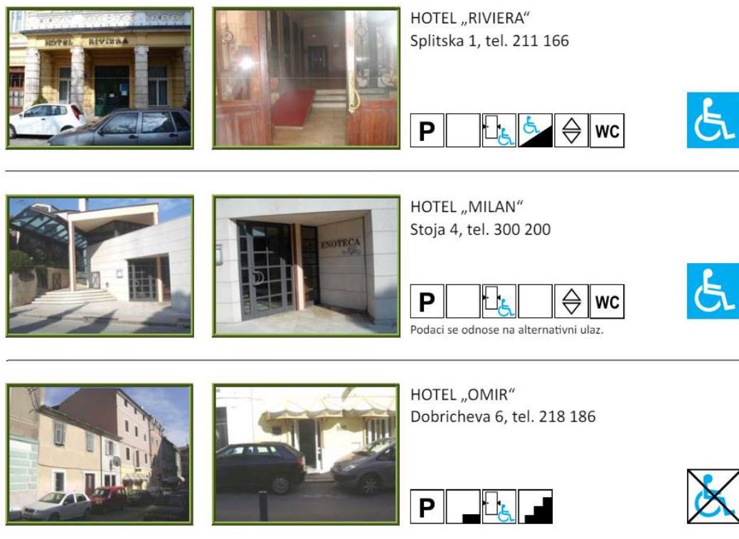
Slika 1. Vodič za osobe s invaliditetom kroz Istarsku županiju - Pula - ugostiteljstvo

Kao primjer dobre prakse može se navesti Istarska županija koja je u suradnji sa Zajednicom saveza osoba s invaliditetom (SOIH) objavila vodič za osobe s invaliditetom kroz Istarsku županiju. Vodič je pokrenut 2012., a njegov cilj je stvaranje okruženja gdje će se svi osjećati ugodno i slobodno kretati. Velika pozornost navedenog vodiča posvećena je okolišu te će poslužiti podizanju svijesti šire javnosti o potrebi prilagođavanja okoliša, a ujedno je namijenjen i turističkim agencijama koje imaju sve više zahtjeva od osoba s invaliditetom kao turističkih posjetitelja. Istarska županija na ovaj način želi pokazati turistima, ali i svojim građanima, da kao jedna uspješna i prepoznata turistička destinacija u svijetu mora pratiti trendove na tržištu i tako se i dalje razvijati u skladu s navedenim potrebama (Mirić i Džanić, 2012.). U vodiču su analizirani različiti objekti i institucije koje bi mogle zatrebati jednom posjetitelju, kao što su ljekarne, obrazovne ustanove, domovi zdravlja i ambulante, crkve i muzeji, trgovine, uredi i javne službe te hoteli i restorani. Na samom početku vodiča dana su objašnjenja simbola koja će se koristiti u vodiču kako bi isti bio što razumljiviji. U nastavke se prikazuje obrada jednog od primjera iz vodiča.