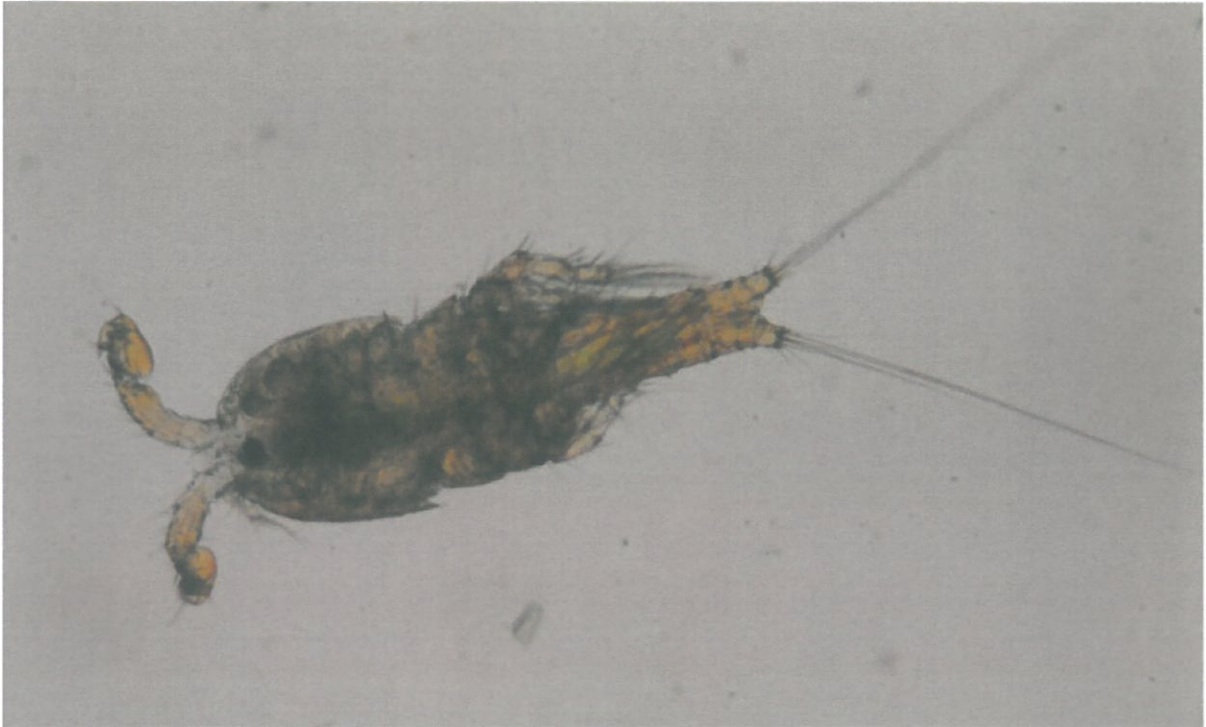
Slika 4. Mužjak vrste Tigriopus japonicus

Svi harpaktikoidi imaju nekoliko zajedničkih karakteristika: visok fekunditet i kratko razdoblje razvoja, oni su eurivalentni organizmi (salinitet 15-70 i temperatura 17- 30 °C), mogu se hraniti različitim tipovima hrane (mekinje riže ili kvasac su povoljnija hrana nego alge) i potencijal ostvarenja visoke gustoće biomase (biomasa pripadnika roda Tigriopus (Slika 3.)hranjenog mekinjama riže drastično se povećava od 0,05 do 9,5 jedinki po ml unutar 12 dana). Uzgoj se može započeti izoliranjem gravidnih ženki (10-100 ženki) u 2 do 40 litara čiste profiltrirane (1 µm) vode. Kultura se održava u gustoći od barem jedne jedinke po mililitru na temperaturi od 24 do 26°C. Nije potrebno dodatno osvjetljenje, ukoliko se uzgoj odvija na otvorenom potrebno je djelomično zasjeniti uzgojne jedinice. Glavni tankovi za uzgoj sadrže 500 litara filtrirane morske vode (100 µm). Optimalna gustoća nasada je 20 do 70 kopepoda po mililitru, sa stopom rasta populacije od približno 15% dnevno.