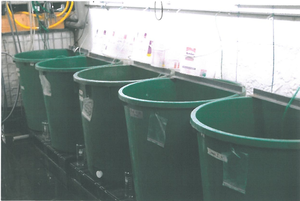
Slika 3. Tankovi za uzgoj kopepoda (prema: Amen, 2014)

viška fitoplanktona. Višak fitoplanktona odumiranjem bi se taložio, u slučaju da se tank ne čisti redovito može doći do odumiranja kulture kalanoida. Zbog navedenog, predlaže se započinjanje uzgoja u tikvici. Kako kultura raste, prebacuje ju se u tankove većeg volumena. Pelagični kopepodi moraju se hraniti planktonskim algama, što se može smatrati nedostatkom u uzgoju jer se uzgoj algi još uvijek zasniva na uzgoju u tikvicama i plastičnim vrećama. Nisu sve alge jednako hranjive za kopepode; sastav masnih kiselina uvelike će utjecati na njihov rast i razmnožavanje.