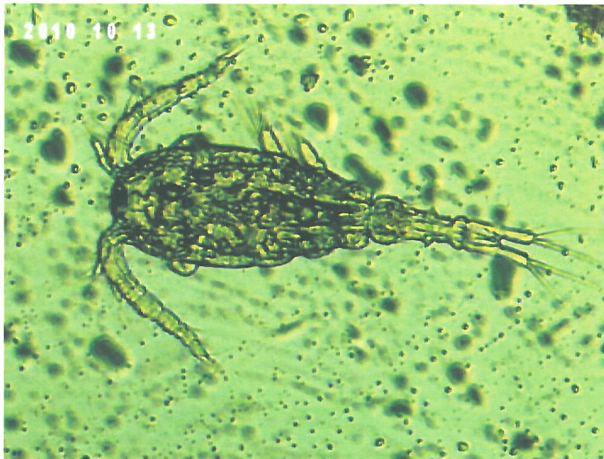
Slika 5. Apocyclops panamnesis

Nekoliko vrsta ciklopidia uzgajalo se u laboratoriju, uglavnom vrste roda Apocyclops (Slika 4). Odrasli kopepod Apocyclops panamnesis izlovljavao se crpkom iz bočate vode (10-27) u 3 tanka zapremine 125 l u kojimasi se nalazile vreće veličine oka 100 \mu\text{m} (Lipman, 2001). Voda je odnesena u laboratorij i filtrirana kroz različite filtere. Odrasli su se skupljali sitom veličine oka od 150 do 350 \mu\text{m} . Apocyclops panamnesis uzgajao se u intenzivnom i ekstenzivnom sustavu, koristio se kao hrana ličinkama vrste Lutifanus campechanus . Ciklopidi su omnivori, mogu se hraniti fitoplanktonom, kvascem i ostalim hranjivima. Pojedine vrste ciklopidia imaju vrlo kratko vrijeme razvoja, 4 do 5 dana do sazrijevanja za vrstu Apocyclops royi (Su i sur., 2005), što je idealno za masovni uzgoj.