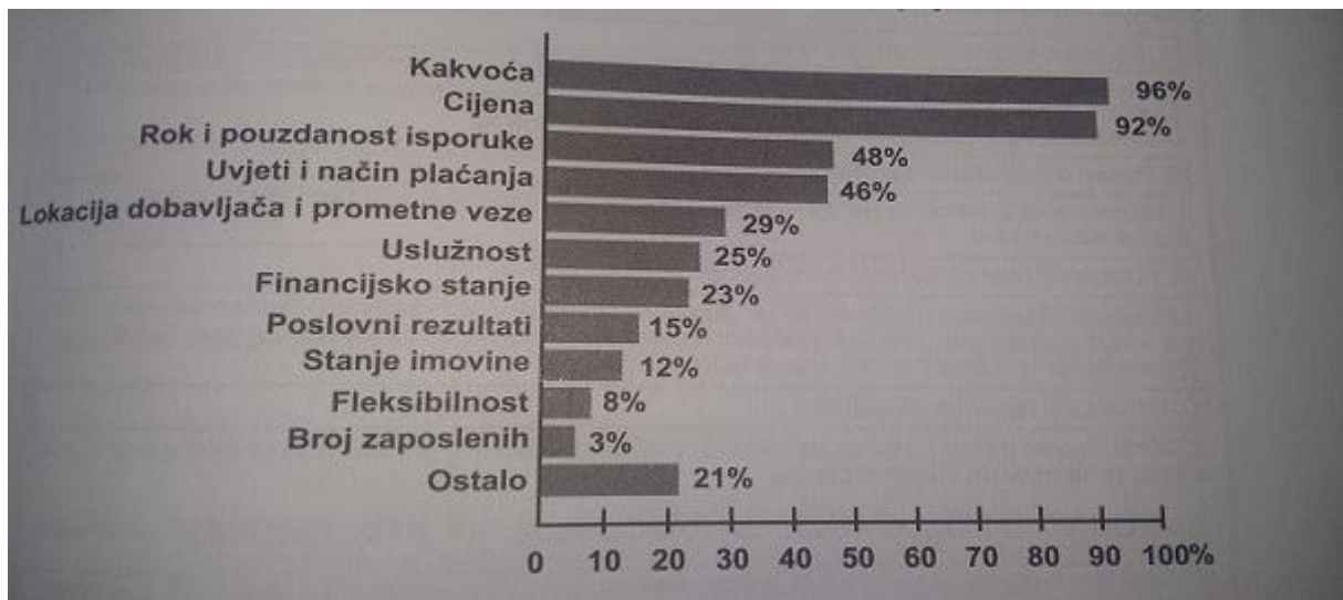
Slika 4. Značenje kriterija za izbor dobavljača prema ispitivanju predstavnika nabave

Izvor: Viliam Freišak, Nabava-politika-strategija-organizacija-managment, 2006. Str.139