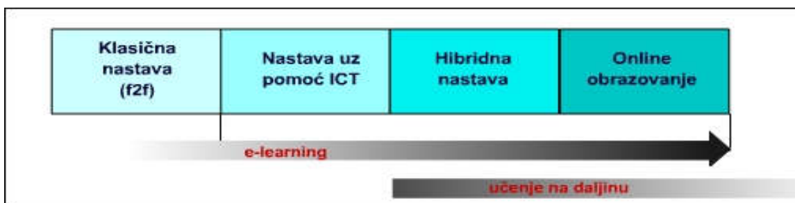
Slika 3: Prikaz E-učenje kontinuum