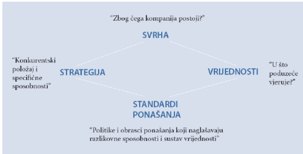
Slika 3. Ashridgeov model misije

Ovisno o različitim shvaćanjima i definicijama misije, postoje i različiti pristupi što se tiče sadržaja misije. Najpotpuniji pristup, koji objedinjuje i strateške i filozofske odnosno vrijednosne aspekte misije jest Ashridgeov model misije, koji je prikazan na slici 3.