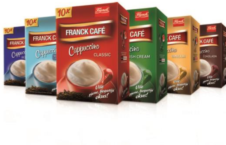
Slika 9. Franck proizvod

Franck uz kavu, čajeve i snack proizvode, nudi iznimno široku paletu proizvoda: kavovine, prilozi jelima, začini jelima, šećeri, proizvodi za pripremu kolača i praškasti proizvodi.