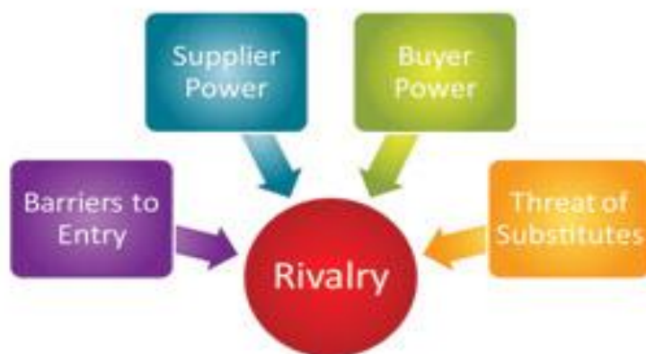
Slika 4. Porterov model pet konkurenstkih sila

Izvor: https://profitiraj.hr/strategija-izvoza-%E2%80%93-porterove-sile-kroz-primjere-iz-prakse/ pristup 1.9.2018.