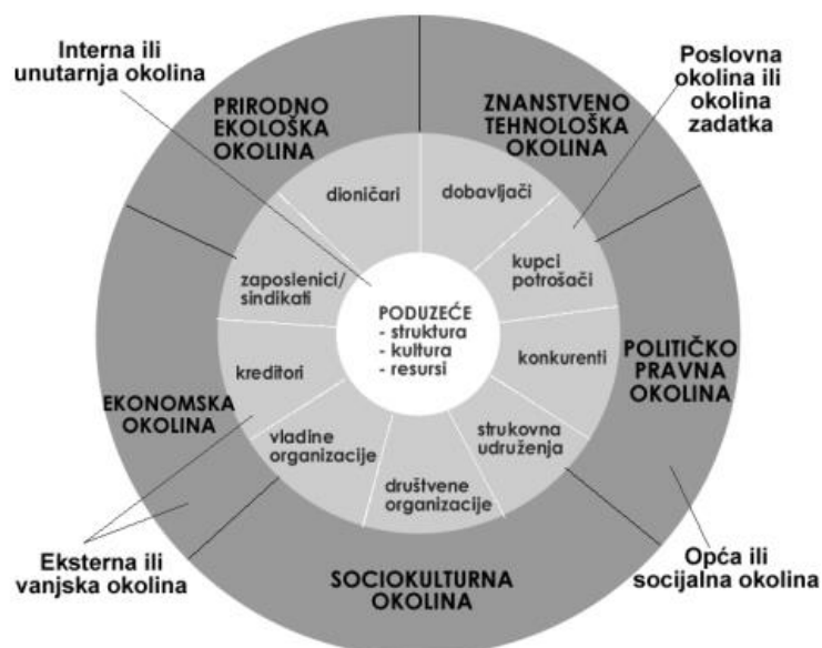
Slika 1. Struktura okoline poduzeća

Na slici 1. Prikazani su elementi okoline organizacije.