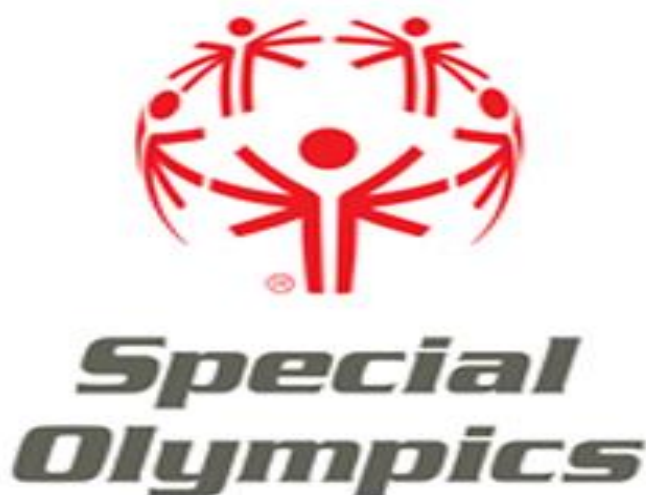
Slika 4. Logo specijalnih olimpijskih igara

https://familyguide.com/special-olympics-texas-aquatics-competition/