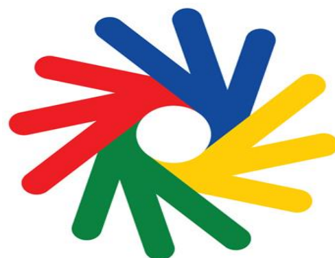
Slika 3. Logo olimpijskih igara gluhih

U Seefeldu u Austriji 1949. godine su održane prve zimske Olimpijske igre gluhih. Sportovi na Olimpijskim igrama gluhih su: curling, alpsko skijanje, skijaško trčanje, hokej na ledu i daskanje na snijegu. Jedina razlika u igrama gluhih od olimpijskih igara je zamjena zvučnog signala svjetlosnim signalom. Osobe s oštećenjem sluha sebe ne smatraju osobama s invaliditetom. Njihova jedina barijera je komunikacija. 18