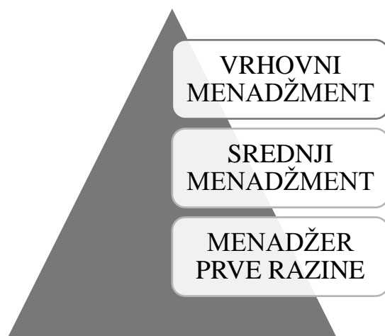
SLIKA 3: Organizacijska piramida

Nije bitno na kojoj se razini nalazite, bitno je da pridonosite razvoju poduzeća i ispunjavanju uloga, te da vjerno i voljno obavljate vaš posao.