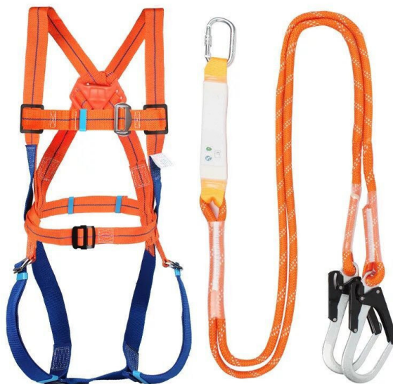
Slika 10. Sigurnosni pojas za rad na visini

Posao na visini obavljaju iskusni pomorci (vježbenici palube ne bi smjeli obavljati posao na visini), te alat koji se koristi prilikom obavljanja takvog posla mora biti osiguran od pada, odnosno mora se držati u torbama ili za to namijenjenim specijalnim opasačima. Zabranjeno je zadržavanje ispod područja gdje se obavlja rad na visini, preporuka je da se za rad pripreme skele koje se prije početka posla moraju adekvatno učvrstiti za brodsku konstrukciju i pregledati da bi se utvrdilo da su sigurne za rad. Pomorci koji rade na visini moraju nositi opremu za osobnu zaštitu koja među ostalim uključuje sigurnosni pojas ( safety harness ), koji će u slučaju pada spriječiti ozbiljne ozljede (slika 10.). Zbog toga je bitno voditi popis sigurnosnih pojaseva na brodu, te ih redovito pregledavati zbog mogućih oštećenja. Pojaseve koji su oštećeni potrebno je odmah ukloniti iz upotrebe, uništiti i izbrisati sa popisa, te naručiti nove. Svaki sigurnosni pojas na brodu mora imati važeći atest da je ispravan i siguran za korištenje.