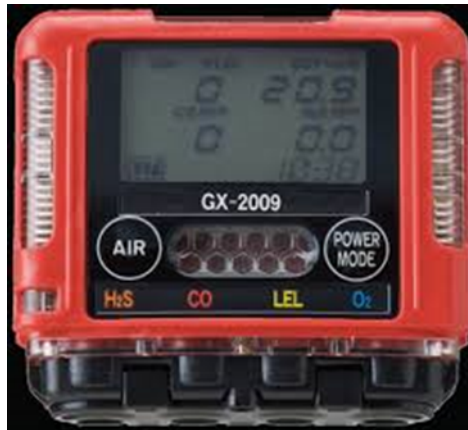
Slika 5. Uređaj za mjerenje postotka kisika i donje granice eksplozivnosti (LEL), te milijuntog dijela ugljičnog monoksida i sumporovodika