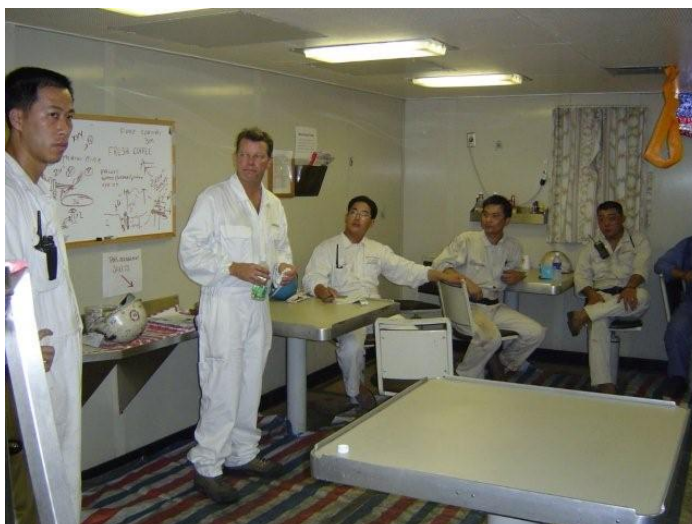
Slika 2. Sastanak posade prilikom izrade procjene rizika