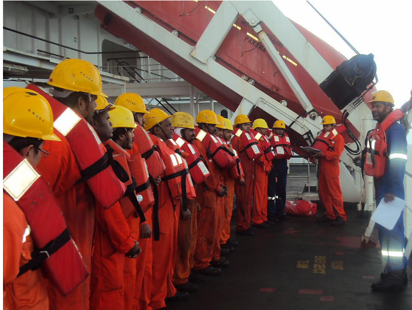
Slika 3. Vježba na brodu za prijevoz rasutih tereta

Upotrebljava se i kao pomagalo pri obavljanju raznih vježbi na brodu (slika 3.) jer naznačuje ispravan način obavljanja raznih zadataka. Uporaba jednostavne dozvole za rad može biti veoma korisna tijekom upućivanju mladih i neiskusnih časnika u njihova zaduženja.