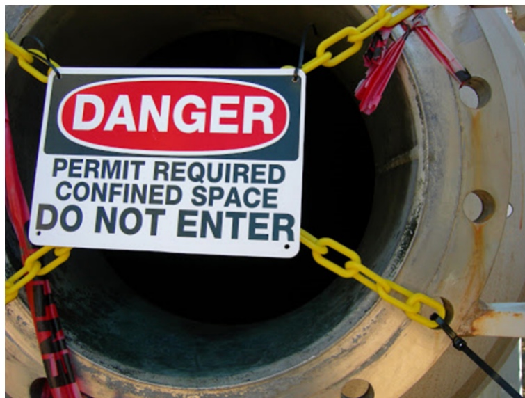
Slika 8. Natpis na ulazu u zatvoreni prostor

Zatvoreni prostori trebaju se temeljito provjetravati koristeći se pritom umjetnom ili rjeđe prirodnom ventilacijom. Prije svakog ulaska u zatvoreni prostor i tijekom boravka u njemu treba se provjeravati razina kisika i otrovnih plinova u njegovoj atmosferi. Prilaz zatvorenom prostoru trebao bi biti ograđen i označen uočljivim natpisom (slika 8.).