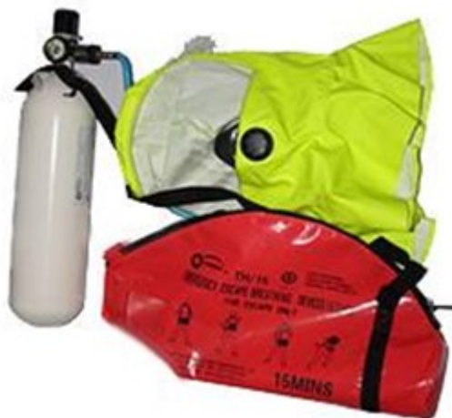
Slika 6. Dišni aparat za izlaz iz prostora u slučaju opasnosti ( EEBD )