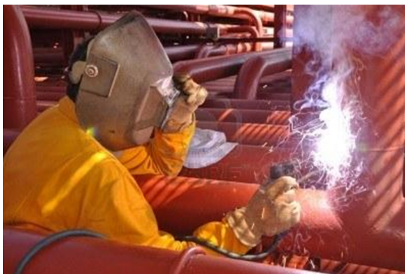
Slika 11. Hot work na brodu

Rad s alatima koji proizvode visoku temperaturu odnosi se na bilo koji rad koji zahtijeva upotrebu otvorenog plamena, primjenu topline ili trenja ili koji može stvoriti iskre ili toplinu (slika 11.). Hot work može biti izvor paljenja kada je prisutan zapaljivi materijal ili može predstavljati opasnost od požara bez obzira na prisutnost zapaljivog materijala na radnom mjestu. U rad s alatima koji proizvode visoku temperaturu spadaju brušenje, bušenje, varenje, lemljenje, rezanje itd., gdje ne rijetko dolazi do iskrenja [3]. Ovakav rad na palubi ili u unutrašnjosti broda može izazvati rizik od nastanka požara ili eksplozije odnosno stradavanja ljudi, a posljedično onečišćenju okoliša. Iz tog razloga potrebno je uspostaviti odgovarajuće skrojen siguran radni sustav. U tom svakako pomažu dozvole za rad s alatima koji proizvode visoku temperaturu (prilog 3.)