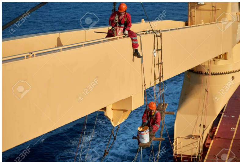
Slika 9. Rad na visini

Prije nego se započne s rad na visini (slika 9.), važno je zatražiti adekvatnu dozvolu za rad, izvršiti procjenu rizika i uzeti u obzir sve potencijalne opasnosti (to može uključivati loše vrijeme ili valjanje broda). Rad na visini uključuje svaki posao koji se izvodi na visini s koje postoji opasnost od pada i ozljede. Kao i kod ostalih dozvola za rad, potrebno je napraviti kvalitetnu procjenu rizika, te sve očekivane rizike svesti na prihvatljive, da bi se uopće pristupilo daljnjoj proceduri izdavanja dozvole za rad na visini. Također je potrebno informirati sve članove posade o planu izvršavanja takvih poslova, kako usmeno, tako i postavljanjem znakova upozorenja, te osigurati da je sva oprema u blizini bitna za navigaciju, a predstavlja opasnost kod rada na visini (poput brodske sirene, ili radarske antene) isključena. Svaka ovakva dozvola sadrži ime odgovornog časnika, članove posade koji obavljaju posao, ime nadzornika posla, te vrijeme i mjesto obavljanja posla.