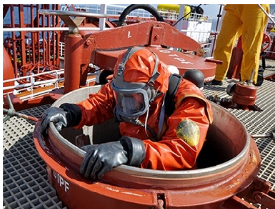
Slika 7. Ulazak u zatvorene prostore