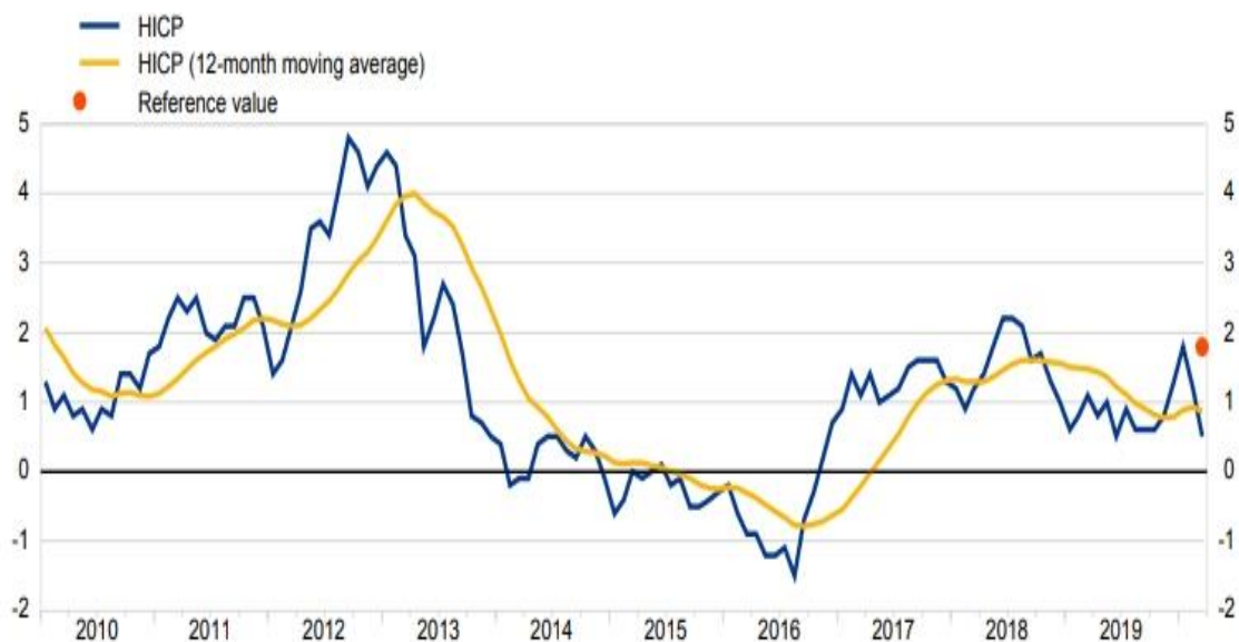
Grafikon 1. Prosječna stopa inflacije mjerena HIPC-om u Hrvatskoj

Hrvatska je članica Europske unije od 1. srpnja 2013. godine. Prema posljednjem Izvješću o konvergentnosti Europske središnje banke, „u ožujku 2020. dvanaestomjesečna prosječna stopa inflacije mjerena HIPC-om u Hrvatskoj je iznosila 0,9%, odnosno bila je znatno ispod referentne vrijednosti za kriterij stabilnosti cijena od 1,8%. U posljednjih deset godina ta je stopa fluktuirala u relativno širokom rasponu od -0,8% do 4,0%, a prosjek u tom razdoblju bio je nizak te je iznosio 1,2%.“ Kao i kod prethodnih zemalja, predviđena je velika razina nesigurnosti vezano za kretanje stope u nadolazećem periodu, no i hrvatska su nacionalna tijela poduzela sve mjere kako bi se umanjila šteta u gospodarstvu.