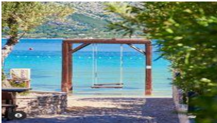
Slika 4: Plaža La'Banya

Zbog poznate ljuljačke, plaža je postala jedna od najpopularnijih u županiji i mnogi mladi je posjećuju samo zbog fotografiranja.