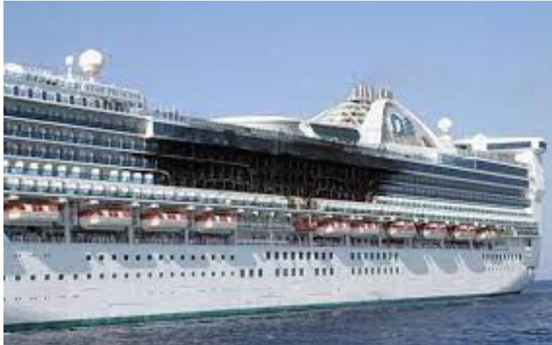
Slika 4. Star Princess nakon požara.

to nije bilo standardno na brodovima za kružna putovanja, a Star Princess nije imao nijedan sprinkler sustav na balkonima.