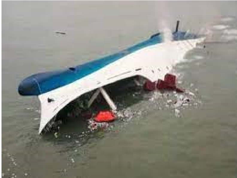
Slika 3. Sewol nakon nezgode.

okrene brod u kurs 145°, pokušavao skrenuti ulijevo kada je shvatio da je naredba značila skretanje u suprotnom smjeru. Teret koji je pao na jednu stranu broda prouzročio je da Sewol izgubi svu mogućnost vraćanja u uspravan položaj i omogućio je da more ulazi u brod kroz krmena bočna vrata prostora za ukrcaj tereta i kroz rampu za ukrcaj vozila (slika 3.).