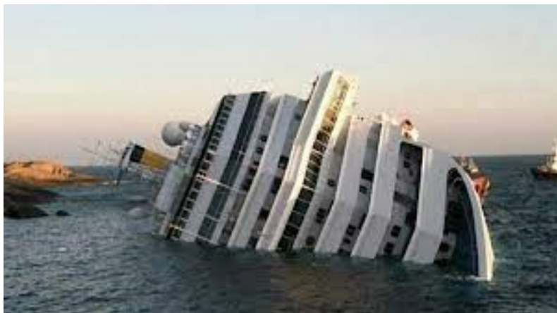
Slika 1. Costa Concordia nakon nasukanja.

indirektno utjecali na diskrecijsko pravo zapovjednika. Šok, nevjerica i prekomjerni stres su pretpostavljeni uzroci grubih pogrešaka posade broda. Iako je Costa Concordia izgubila pogon može se reći da su vjetar i zaglavljeno kormilo doveli do toga da se Costa Concordia usmjerila natrag prema otoku, te na taj način je pukom srećom izbjegnuta velika tragedija.