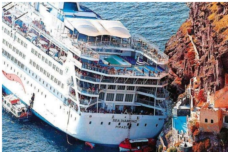
Slika 2. Evakuacija broda Sea Diamond.

(187 stopa), kako je pogrešno označeno na nautičkoj karti. Službena karta također pokazuje dubinu vode na području udara koja varira od 18-22 metra (59-72 stope), dok nedavno istraživanje pokazuje da je samo 5 metara (16 stopa) [5].