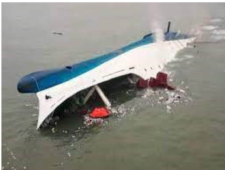
Slika 3. Sewol nakon nezgode.

okrene brod u kurs 145°, pokušavao skrenuti ulijevo kada je shvatio da je naredba značila skretanje u suprotnom smjeru. Teret koji je pao na jednu stranu broda prouzročio je da Sewol izgubi svu mogućnost vraćanja u uspravan položaj i omogućio je da more ulazi u brod kroz krmena bočna vrata prostora za ukrcaj tereta i kroz rampu za ukrcaj vozila (slika 3.).