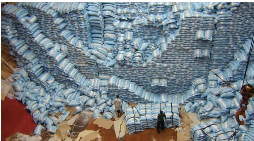
Slika 14. Nasilno izvlačenje donjih vreća može uzrokovati štete na teretu ali i ozljede slagača.