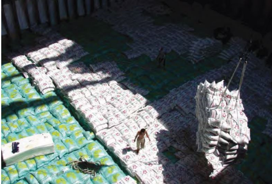
Slika 6. Prikaz ventilacijskih kanala prilikom ukrcaja riže.

u temperaturi okolnog zraka i morske vode prilikom putovanja mogu dovesti do stvaranja kondenzacije, a za terete u vrećama potrebno je osigurati odgovarajuće ventilacijske kanale unutar skladišta tijekom utovara (slika 6.). Mjesto i broj ovih kanala bit će određeni uputama za prijevoz [7].