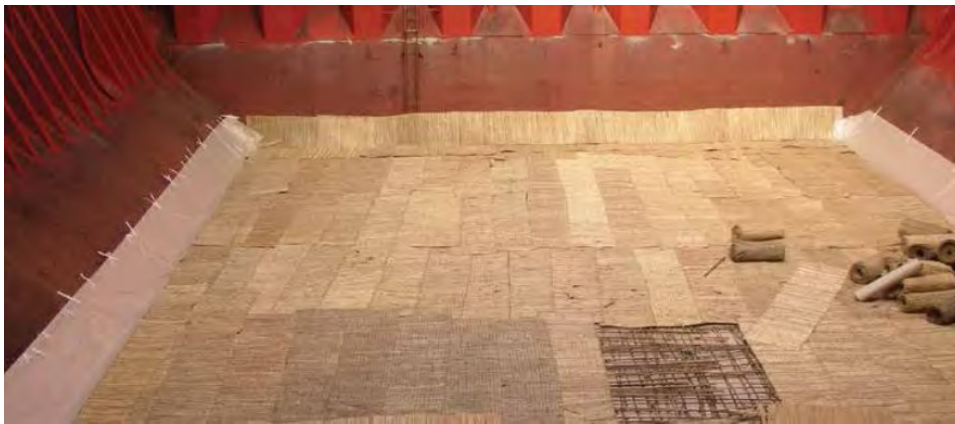
Slika 3. Primjer pripreme podloge od bambusa u brodskom skladištu.

U nekim je lukama uobičajena praksa da se teret riže štiti korištenjem kombinacije bambusovih prostirki i štapova. Ovi materijali se i danas naširoko koriste zbog pogrešnog uvjerenja da pružaju najbolju moguću zaštitu. Podloga se obično sastoji od bambusovih štapova položenih u križni uzorak na čelični pokrov dvodna [2]. Primjer podloge od bambusa na pokrovu dvodna prikazan je na slici 3.