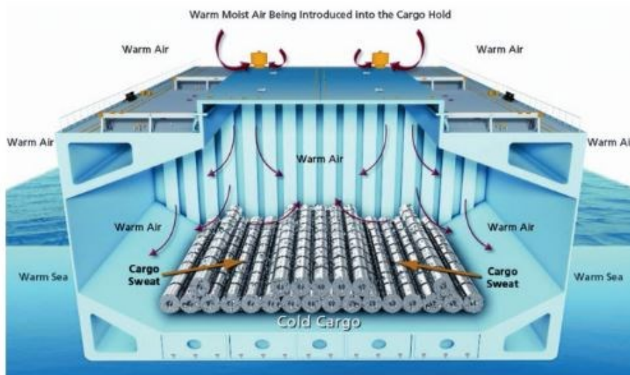
Slika 13. Znojenje tereta.