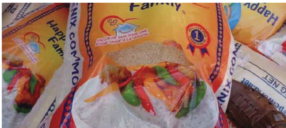
Slika 15. Rasparana vreća riže znak je sitne krađe prilikom rukovanja teretom.