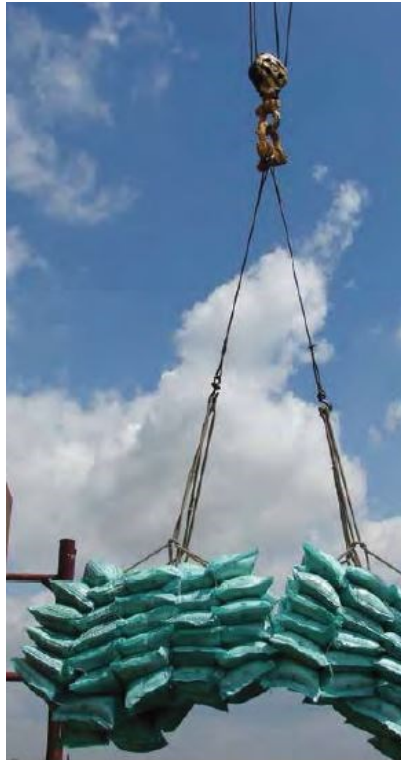
Slika 7. Ukrcaj riže u vrećama na brod.