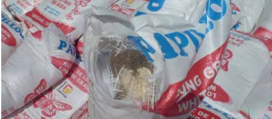
Slika 11. Poderana vreća riže.

prateću dokumentaciju za časničku potvrdu ( mate's receipt ). U slučaju oštećenja, časnička potvrda treba biti izdana s relevantnim napomenama koje odražavaju količinu i vrstu pronađene štete. Na primjer, „dvije poderane vreće“ (slika 11.), „pet vreća s promijenjenom bojom“, „tri pljesnive vreće“ ili „četiri pošiljke blago/umjereno/jako zaražene živim štetočinama“ [2].