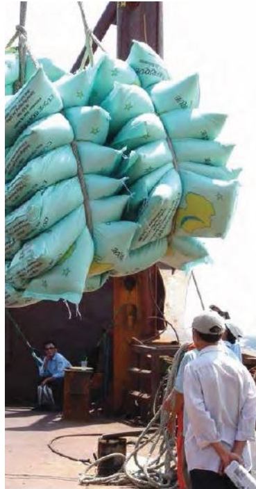
Slika 8. Pregled i brojanje vreća riže prilikom ukrcaja.