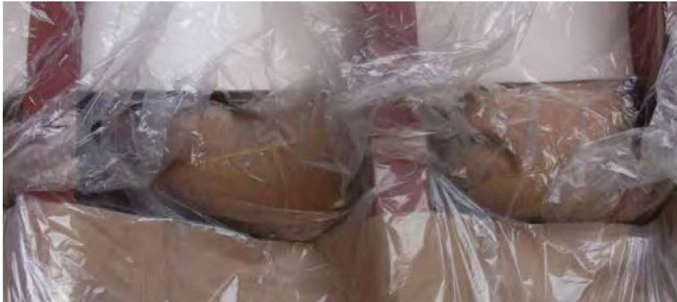
Slika 4. Piljevina u vrećama umetnuta na prijelazu između bočne oplata i donjeg bočnog tanka.