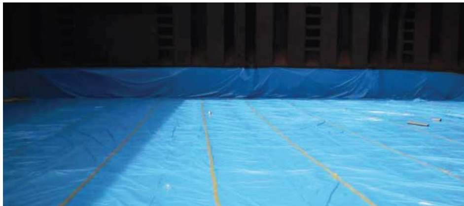
Slika 2. Pokrov dvodna prekriven plastičnom folijom postavljenom preko kraft papira.

Neki unajmljivači zahtjevaju da se kraft papir stavlja izravno na pokrov dvodna ili strane skladišta, a zatim da se prekrije plastičnim folijama, na temelju toga što ovakav raspored povezuje teret kao u „plastičnoj vreći“ (slika 2.) Međutim, ova metoda može učiniti teret posebno osjetljivim na oštećenja uslijed kondenzacije pa bi posada broda trebala biti svjesna mogućnosti takvih šteta. Posada broda treba voditi fotografsku evidenciju primijenjenog materijala za podlaganje prije i nakon završetka ukrcaja [2].