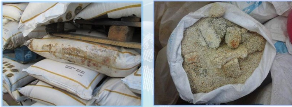
Slika 5. Štete zbog vlage na vrećama riže.

osiguravanje zračnog prostora između čelične konstrukcije skladišta i tereta te odgovarajućih ventilacijskih kanala unutar složenog tereta. Većina brodova, međutim, nema mehanička sredstva za ventilaciju. Poznato je iz prakse da neki brodari odlučuju otvoriti poklopce grotala skladišta tijekom putovanja što je više moguće i kada to uvjeti dopuštaju [2,3,5,7].