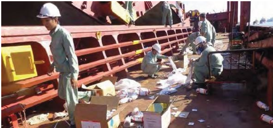
Slika 10. Pesticidi koji se koriste za fumigaciju raspršuju se u teretna skladišta.

Fumigacija se mora primjenjivati prilikom otkrivanju insekata, štetnika ili njihovih ostataka u teretu. Da bi fumigacija bila učinkovita, potrebno je dobro osigurati nepropusnost svih poklopaca skladišta, ventilacijskih otvora i pristupa. Navedene operacije fumigacije također moraju biti u skladu sa smjernicama Međunarodne pomorske organizacije (IMO) sadržanima u okružnicama MSC.1/Circ.1264 1 (Preporuke o sigurnoj upotrebi pesticida na brodovima koje se primjenjuju na fumigaciju skladišta tereta) i MSC.1/Circ.1358 2 (Revidirane preporuke o sigurnoj upotrebi pesticida na brodovima). U njima se navodi da posada ne smije rukovati fumigantima i zahtijeva se da fumigaciju provode kvalificirani operateri (slika 10.) [8].