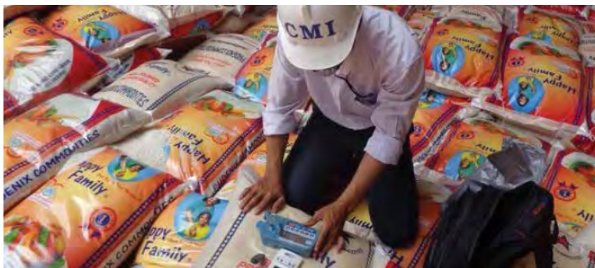
Slika 9. Inspektor tereta koji mjeri sadržaj vlage izravno iz vreće riže u skladištu tereta.

Uobičajeni sadržaj vlage za rižu je između 15 % do 22 % (Sjedinjene Američke Države) ili 19 % do 25 % (Azija) i obično se suši do sadržaja vlage od 12 % do 14 % kako bi se spriječilo kvarenje. Za prekomorski transport, idealan sadržaj vlage za rižu po dolasku na brod trebao bi biti između 14 % i 14,5 %. Inspektor tereta morati će ispitati dovoljan broj uzoraka punih vreća riže kako bi se osigurao odgovarajući sadržaj vlage po dolasku tereta na brod, kao što je prikazano na slici 9. Utvrđeno je da je to posebno zabrinjavajuće za terete riže podrijetlom iz Vijetnama, pa je stoga potrebno provesti testove s više uzoraka.