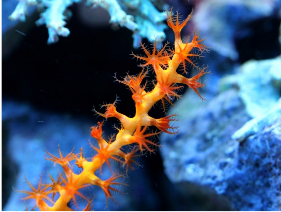
Slika 3. Koralja Swiftia exserta (Ellis & Solander, 1786)