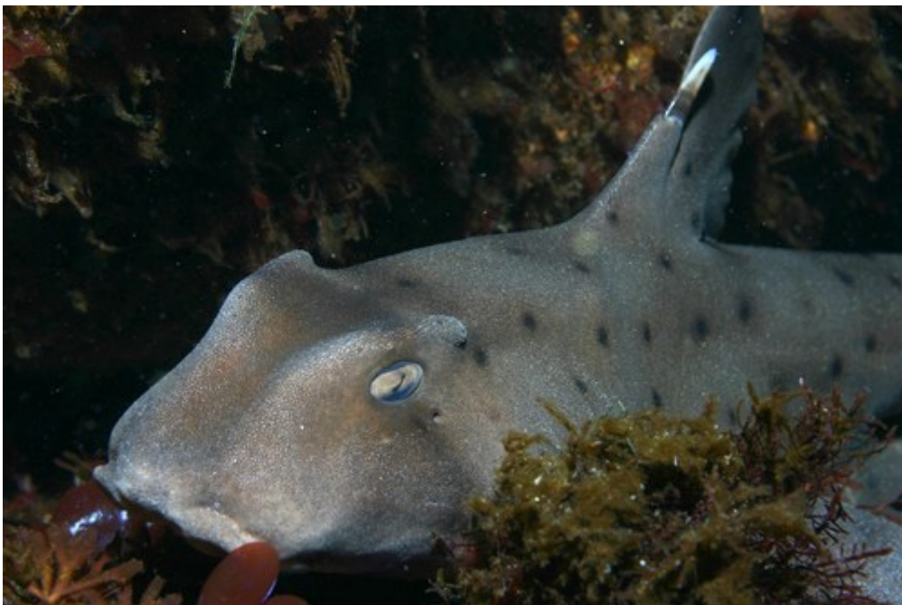
Slika 5. Morski pas Heterodontus francisci , Girard, 1855

Girard, 1855 (Slika 5), otkriveno je da je svaki receptor na antitijelu za određeni antigen nastao kroz interakciju dvaju lanaca amino kiselina, laki i teški. Prosječna molekula se sastoji od dva para lanaca i dva područja na kojima se nalaze receptori za antigene. Mjesto gdje će se vezati antigen na receptor ovisi o tipu, mjestu i poziciji amino kiselina od kojih se sastoje lanci. Postoje četiri tipa antitijelnih gena V, D, J i C. Teški lanci su specificirani sa 3 genska segmenta, dok su laki lanci samo sa V i J. C segment determinira vrstu i karakteristike antitijela. Za razliku od ljudskog, teški lanac morskog psa ima samo jedan V, dva D, jedan C i jedan J segment (Litman, 1996).