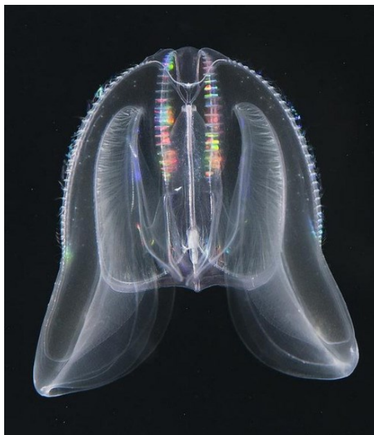
Slika 4. Rebraš Mnemiopsis leidyi A. Agassiz, 1865