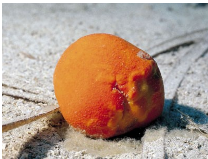
Slika 2. Kremenorožnjača Suberites domuncula (Olivi, 1792)

Skoro sve kremenorožnjače u sebi sadrže bakterije. Nakon novih istraživanja, pogotovo na vrstama Suberites domuncula (Olivi, 1792) (Slika 2) i Geodia cydonium (Linnaeus, 1767) došlo je do saznanja da spužve dijele mnoge imunološke sličnosti sa višim mnogostaničnim životinjama. Spužve posjeduju efektivni obrambeni sustav protiv mikroba i parazita koji uključuje apsorpiranje bakterija specijaliziranim stanicama i signalne puteve transdukcije koji aktivno ubijaju bakterije. Dio tog sustava je i put posredovan lipopolisaharidima i kinazom osjetljivom na stres. Važan mehanizam obrane je intracelularno probavljanje. One posjeduju specijalizirane ameboidne stanice, arheocite. Imaju jako visoku razinu raspoznavanja domaćinskih i stranih stanica. Na vrsti G. cydonium je otkriveno da kremenorožnjače posjeduju obrambeni sustav protiv bakterija i virusa, (2-5)A(2'-5') oligoadenilat sintetazu. Ovaj je enzim pronađen kod spužvi u podcarstvu deuterostomia, ali nedostaje u podcarstvu protostomia. Sinteza proteina u tkivima je inhibirana nakon inkubacije bakterijskog endotoksin lipopolisaharida. Kod spužve G. cydonium , su izolirane molekule slične Ig, receptorska tirozin-kinaza (RTK) i adhezijske molekule spužve (SAM) (Müller i sur, 2003).