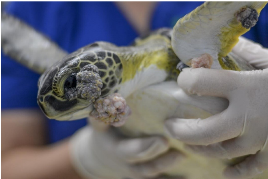
Slika 6. Tumori uzrokovani bolešću FP na kornjači Caretta caretta (Linnaeus, 1758)

srž glavno mjesto za hematopoezu (Zimmerman, 2018). Za razliku od sisavaca koji imaju leukocite, oni imaju pretke leukocita, heterofile. Bazofili na površini sadrže Ig specifične za antigene. Citokini mogu proizvesti dušikov oksid koji je toksičan bakterijama i parazitima (Rios i sur., 2015). Gmazovi su poikilotermni, koriste svjetlosnu energiju za toplinu, te je ona od iznimne važnosti za njihov imunološki sustav. Tokom zime ili nepogodnih uvjeta oni se oslanjaju najviše na urođeni imunitet (Barnes, 2007). Temperatura na kojoj se jaja inkubiraju, osim utjecaja na spol, također može utjecati na razvoj imunološkog sustava gmazova (Zimmerman, 2018). Za morske kornjače već je neko vrijeme jedna od većih prijetnji FP (Slika 6), bolest koja uzrokuje tumore na mekanim tkivima (Hutchinson i sur., 1992).