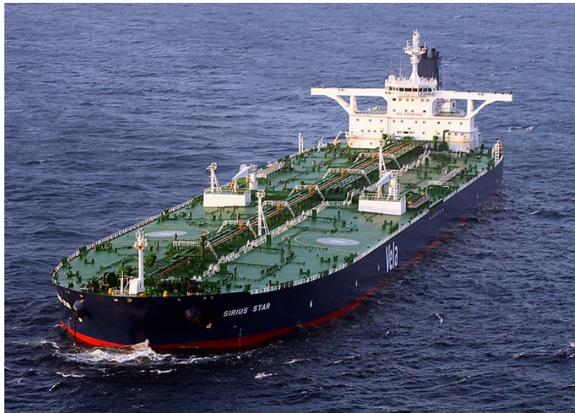
Slika 2.: Tanker