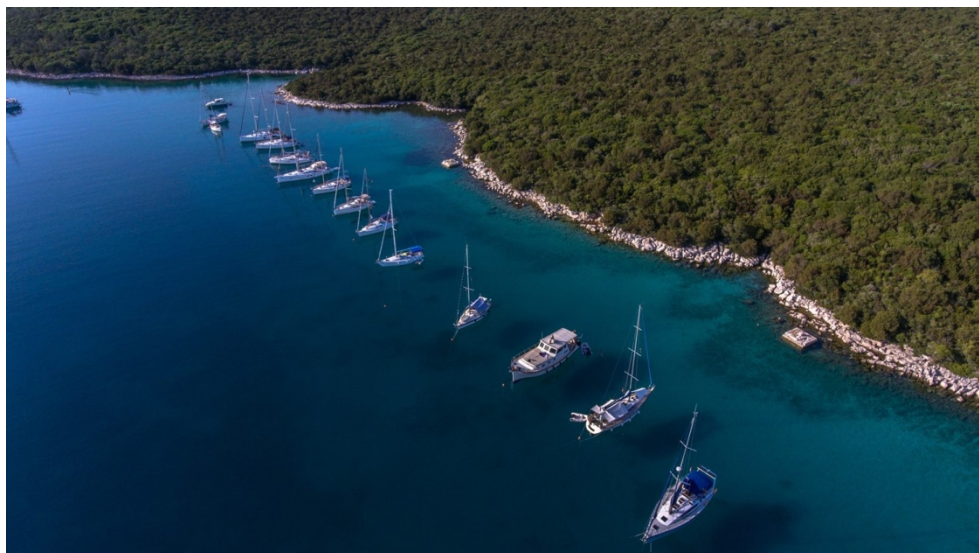
Slika 1. Sidrište Maračol na otoku Unije.