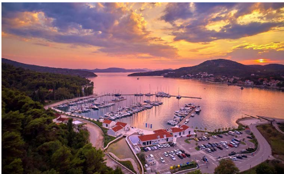
Slika 9. Marina "Veljko Barbieri" u Slanome

Dubine luke su između deset i trideset pet metara, a plićine su blizu obale s minimalnom dubinom od pet metara. Marina je opremljena Teslinom punionicom, tesustavima za pražnjenje fekalnih i zauljenih voda. Dubrovačko primorje nudi 50 km dugu biciklističku stazu, a usklupu marine nudi se usluga iznajmljivanja bicikla, što privlači aktivne turiste[25].