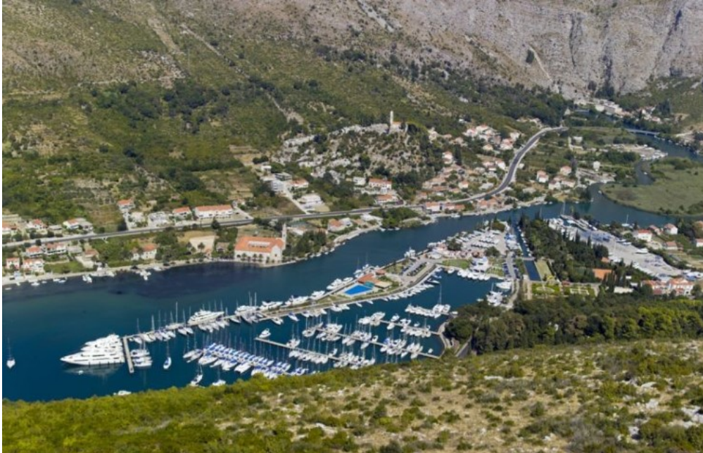
Slika 8. ACI marina Komolac (Dubrovnik)

2008. godine bilo je 6 500 tranzitnih vezova čiji je prosjek bio 2 noćenja, što bi značilo da je marina imala 13 000 'brod-noćenja'. Danas marina broji oko 4 000 'brod-noćenja' godišnje zbog toga što je sve više stalnih vezova, a i brodice su sve veće duljine [2].