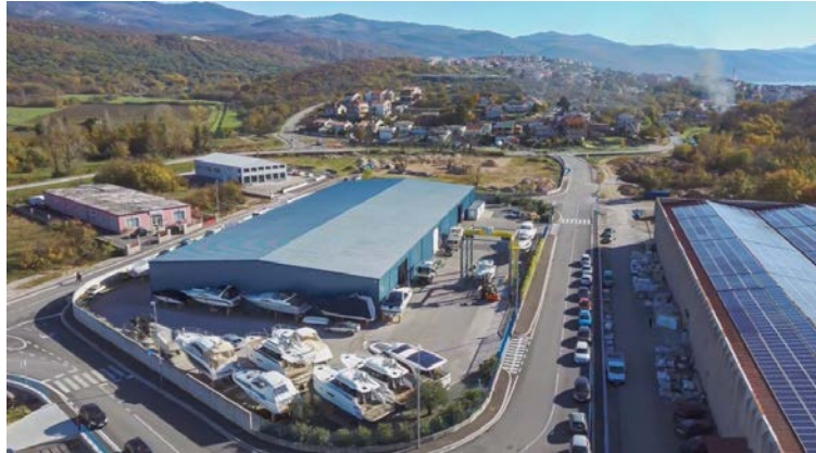
Slika 3. Suha marina u Novom Vinodolskom, najveća suha marina u RH