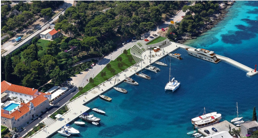
Slika 2.Privezište na otoku Šolti.