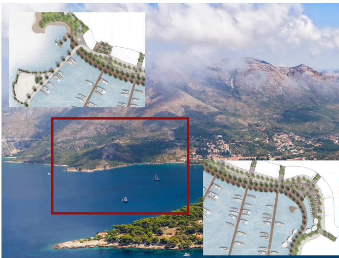
Slika 12. Lokacija budućeg resorta u Cavtatu

Planirana luka nautičkog turizma Prahivac kod Cavtata nalazi se unutar turističko-ugostiteljskog kompleksa na površini od 8,6 ha, s kapacitetom od 1 200 ležajeva. Luka će imati do 120 vezova, s komplementarnim sadržajima za turiste i nautičare. Prije izgradnje potrebna je Studija utjecaja na okoliš jer se nalazi unutar NATURA 2000 ekološke mreže. Luka je zaštićena od nekih vjetrova, no lukobran je potreban zbog vjetrova sa jugozapada, zapada i sjeverozapada. Dubine su povoljne za gradnju marine, a predviđa se priključenje na sustav odvodnje radi zaštite okoliša, osobito zbog obližnjih kupališta.