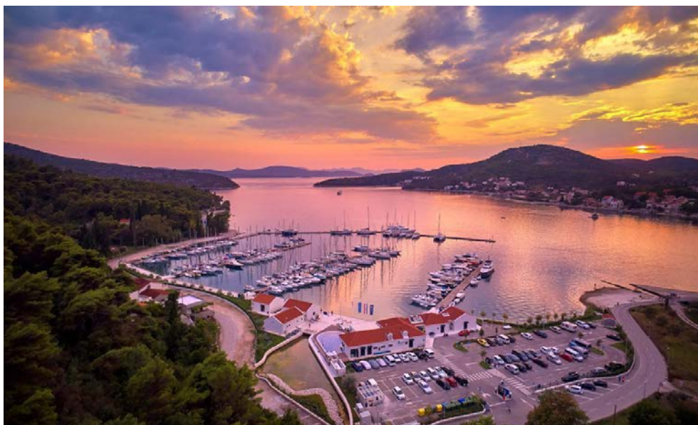
Slika 9. Marina "Veljko Barbieri" u Slanome

Dubine luke su između deset i trideset pet metara, a plićine su blizu obale s minimalnom dubinom od pet metara. Marina je opremljena Teslinom punionicom, tesustavima za pražnjenje fekalnih i zauljenih voda. Dubrovačko primorje nudi 50 km dugu biciklističku stazu, a usklupu marine nudi se usluga iznajmljivanja bicikla, što privlači aktivne turiste[25].