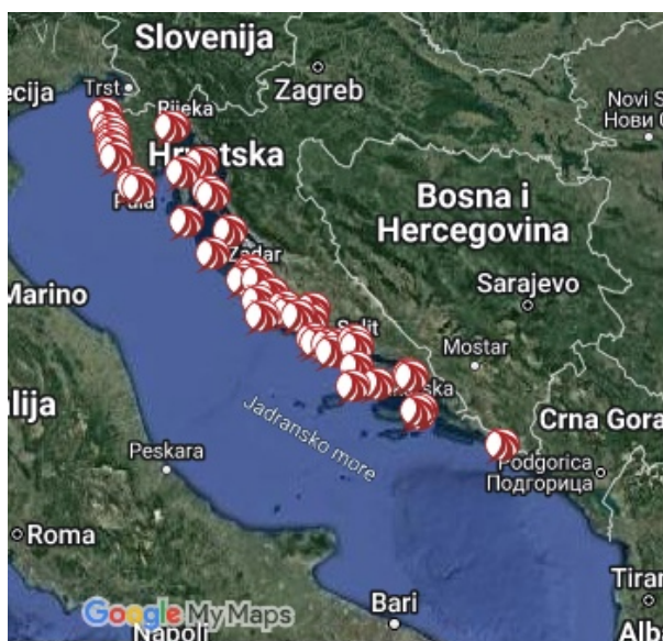
Slika 6. Mapa s marinama u Hrvatskoj

Hrvatska obala ima mrežu od šezdeset pet marina s ukupnim kapacitetom većim od 16000 morskih te 8500 kopnenih vezova. Protežu se duž cijele obale, od Umaga do Dubrovnika.. Mnoge od njih nagrađene su Plavom zastavom za očuvanje mora i obale. ACI (engl. Adriatic Croatia International Club ) vodeća je tvrtka s lancem od dvadeset dvije marine, što ga čini najvećim sustavu marina u Europi [1].