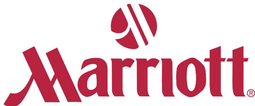
Slika 1 Logo Marriott