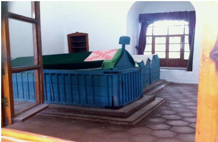
2015. godine