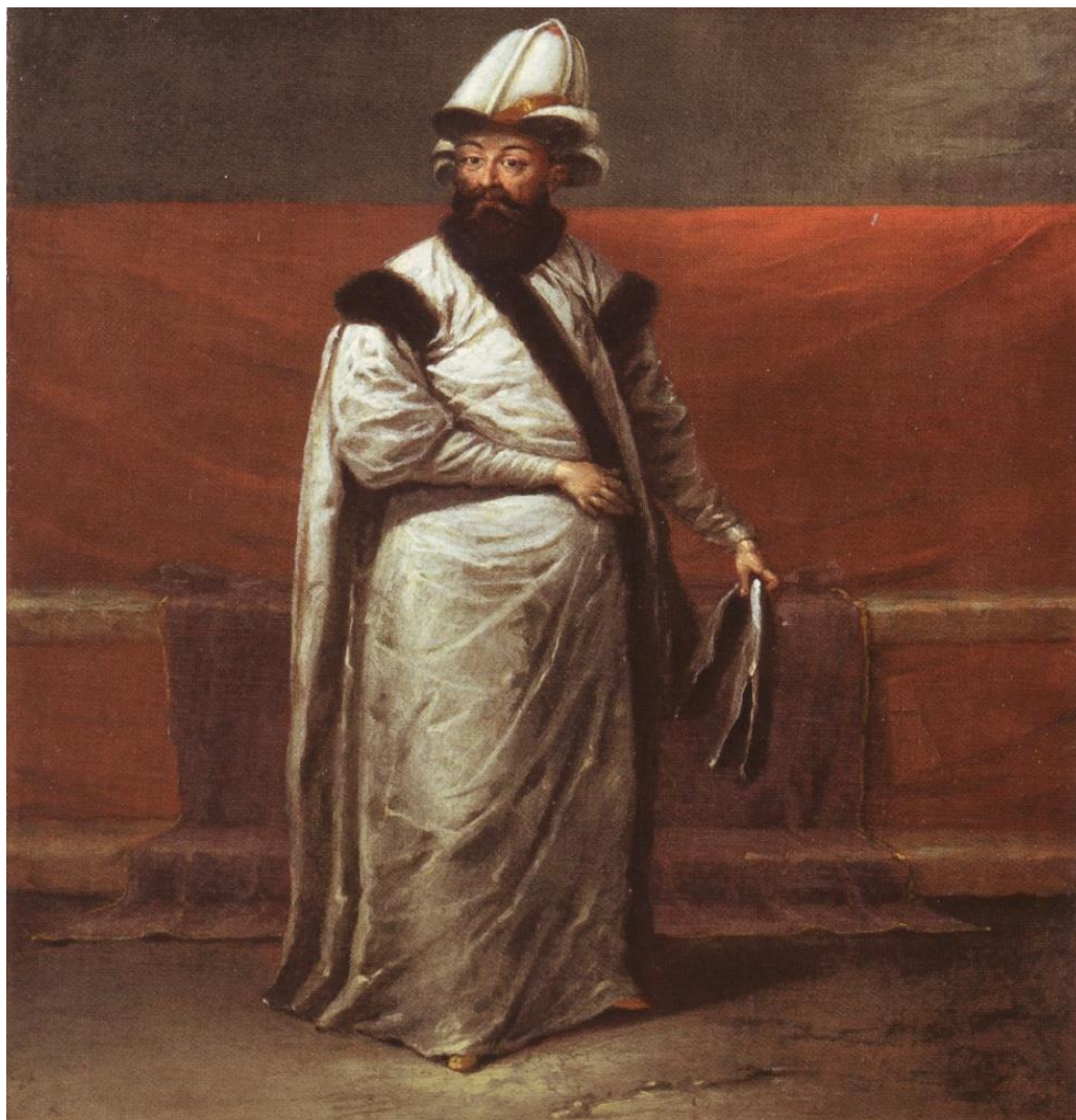
Jean Baptiste Vanmour, De grootvizier 1700-1737, SK-A-2018, Rijksmuseum, Nizozemska