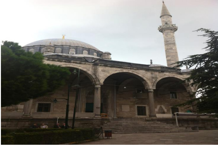
Slika broj 2. Dijelovi Ali-pašinog vjerskog kompleksa ( külliye ): džamija, knjižnica i turbe