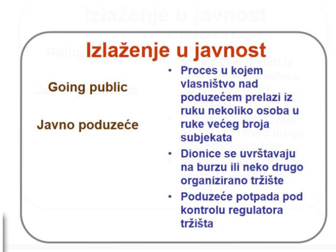
Slika 2: „Izlaženje u javnost ( Going public)- Uvođenje“