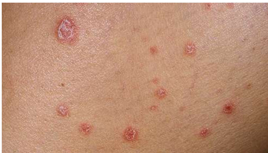
Slika 2. Psoriasis gutatta – kapljičasta psorijaza

Pustulozna psorijaza ( Psoriasis pustulosa ) rijetko se pojavljuje u dječjoj dobi, iako je opažena i u dojenčadi. Očituje se crvenkastim žarištima različite veličine i oblika sa pustulama na površini. Psoriasis pustulosa palmo-plantaris očituje se crvenkastim žarištima s pustulama na dlanovima i stopalima.