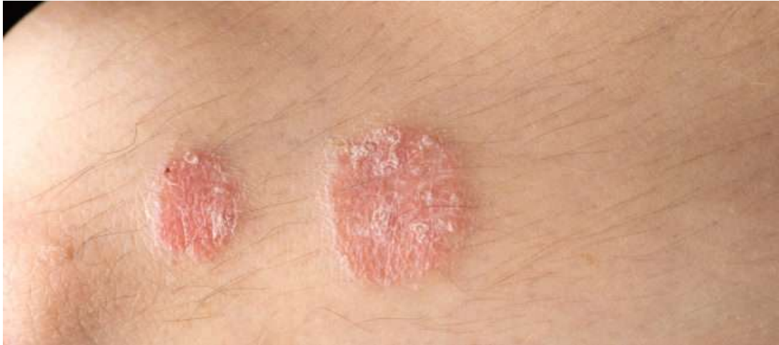
Slika 1. Tipičan psorijatični plak prekriven srebrenkastim ljuskama

Psorijaza (grč. psora = ljuska) je kronična upalna bolest kože obilježena pojavom oštro ograničenih crvenkastih ploča prekrivenih srebrno bijelim ljuskama. Osim kože, bolest redovito zahvaća vlasište i nokte, a u pojedinih bolesnika i zglobove u vidu psorijatičnog artritisa 4 .