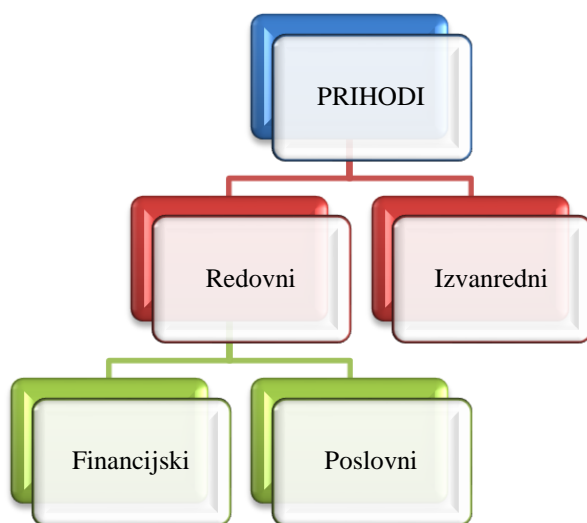
Slika 2. Podjela prihoda

prikazuje kako se prihodi dijele s obzirom na činjenicu da se mogu javljati redovito i povremeno (Žager & Žager, 1999, str. 47).