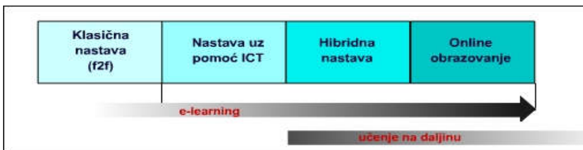
Slika 3: Prikaz E-učenje kontinuum