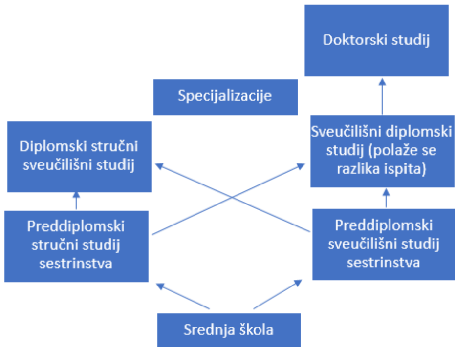
Slika 2: Vertikalna obrazovanja medicinskih sestara u RH