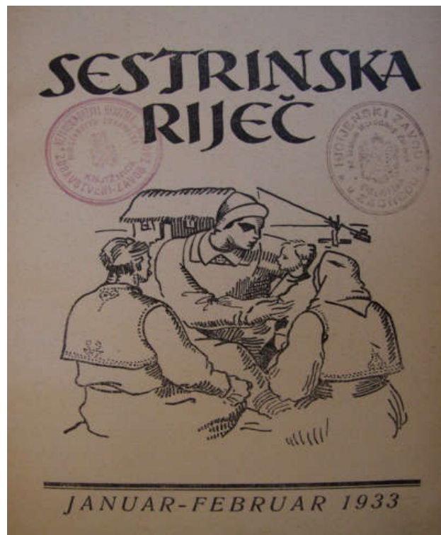
Slika 5: Časopis sestrinska riječ

Medicinske skrb sustavno znanje i vještine koje može prenositi podučavanje, dobro organiziranim sustavom obrazovanja, ali i stručnim jezikom. U tom kontekstu bitan segment čini i znanstvena literatura napisana od medicinskih sestara. Medicinske sestre počele su objavljivati svoje prve stručne publikacije u Hrvatskoj u specijaliziranom medicinskom časopisu pod nazivom Sestrinska riječ . Časopis je objavljen kao dvostruko izdanje, a prvi se broj pojavio 1. veljače 1933. godine (38).