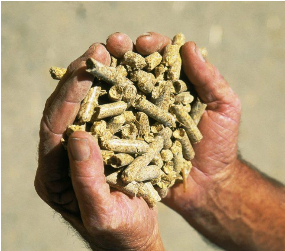
Slika 15. Stočna hrana ( fodder )

Engleski izraz za stočnu hranu je fodder , koji se ujedno koristi i u praksi. Prilikom ukrcanja stoke ukrcava se i fodder pomoću lučkih strojeva, koji se spajaju između kamiona i broskog tanka. Ocean Drover posjeduje dva tanka za fodder , ukupnog kapaciteta od 1500 t.