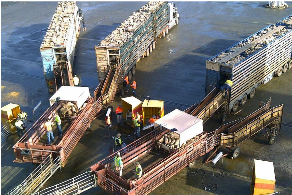
Slika 17. Kamioni spojeni na rampe

Prije početka samog ukrcaja kamioni sa životinjama za ukrcaj idu na vaganje. Posada broda priprema ukrcajnu opremu, odnosno rampe koje montiraju na rivu u odgovarajućoj poziciji. Važno je da rampe budu dobro postavljene i da posada koja je na dužnosti motri poziciju rampe, jer dolazi do nagiba broda prilikom ukrcaja, te zbog morskih mijena.