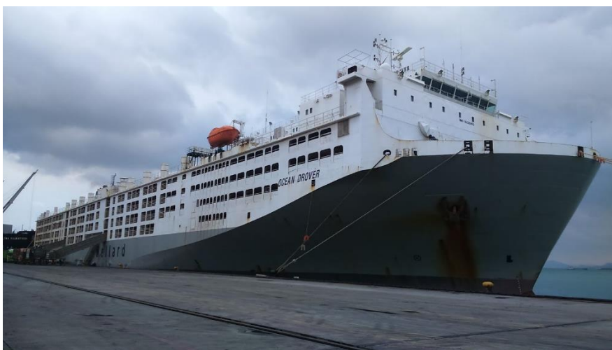
Slika 10. M/V Ocean Drover u Panjangu