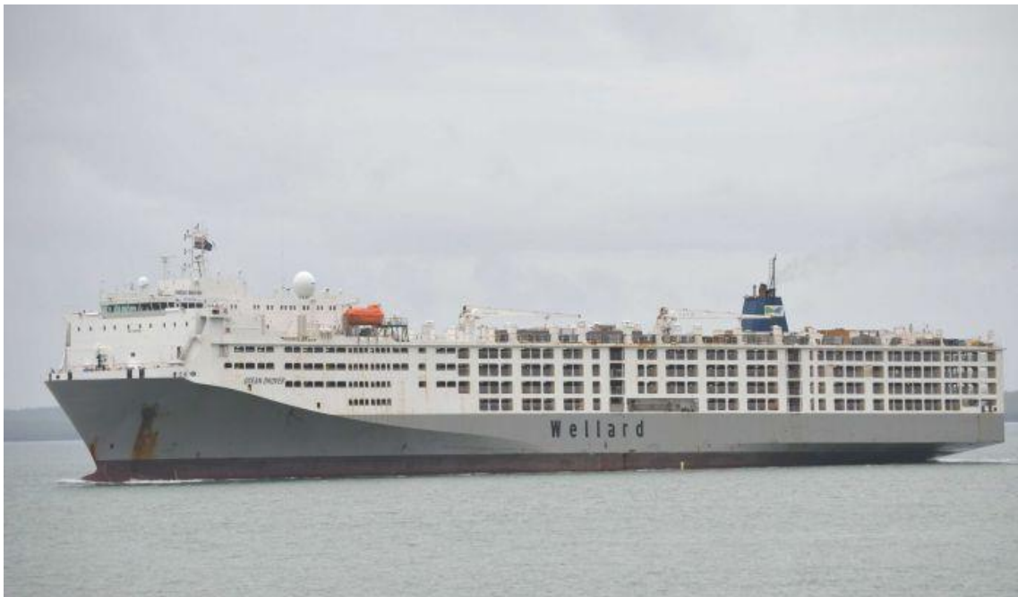
Slika 7. M/V Ocean Drover

https://photos.marinetraffic.com/ais/showphoto.aspx?photoid=2049416&size=800