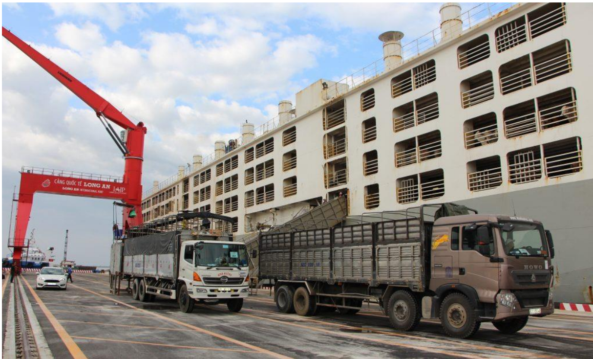
Slika 21. M/V Ocean Drover u Long An Internationalu

Sam iskrcaj poput ukrcaja počinje postavljanjem rampa i putova kojima će se životinje kretati. Kao što je već naglašeno prilikom ove operacije stockmani raspodjeljuju brodsku posadu, te vodu sam iskrcaj u suradnji s prvim časnikom palube. Na slici 21. je Ocean Drover kao prvi brod u iskrcajnom odredištu, novoizgrađenom terminalu Long An International u Vijetnamu dok se priprema za iskrcaj.