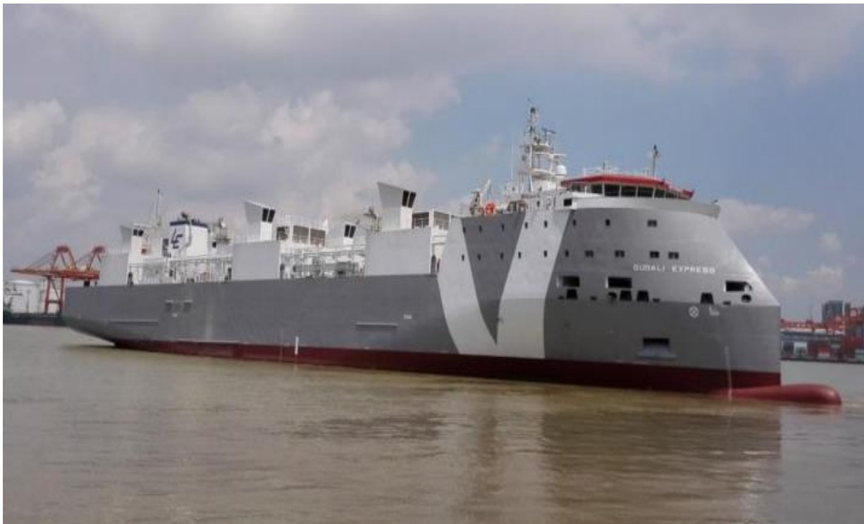
Slika 9. M/V Gudali Express

Međutim problem predstavlja činjenica da je ventiliranje paluba za teret ovisno o mehaničkoj ventilaciji, što zahtjeva što kvalitetniju i sigurniju izvedbu istih, uz ugradnju pomoćnih sredstava u slučaju nužde za napajanje ventilacijskih instalacija. Ovo je jako bitna stavka kod gradnje brodova za prijevoz stoke zatvorenog tipa, jer se u slučaju prestanka ventiliranja životinje mogu ugušiti u vremenskomu rasponu od nekoliko sati. Također to predstavlja opasnost i za sve članove posade koji rade u zatvorenim prostorijama. Na slici 9. je brod zatvorenog tipa za prijevoz stoke Gudali Express, nizozemske kompanije Vroom, koja je jedan od značajnih brodara u prijevozu stoke.