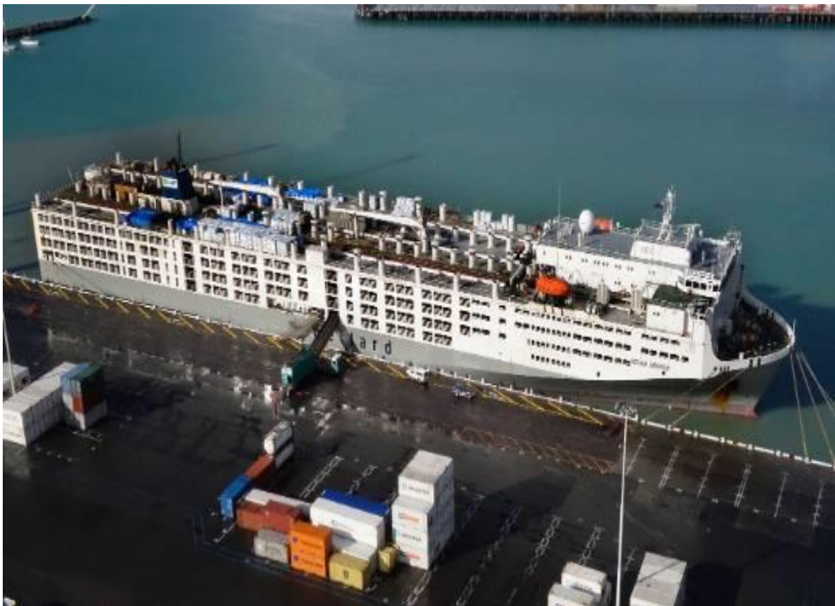
Slika 16. M/V Ocean Drover spreman za odlazak iz luke

Na slici 16. se može vidjeti sun deck Ocean Drovera na kojemu je ukrcaj i složen veliki broj bala sijena i piljevine. Također se može uočiti jedna od ukrcajnih rampa spojenih na brod.