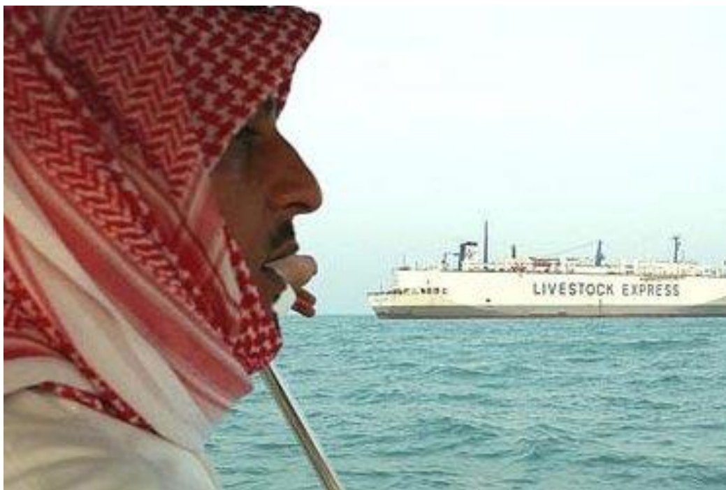
Slika 3. M/V Cormo Express

http://www.abc.net.au/cm/rimage/1488182-3x2-medium.jpg?v=4