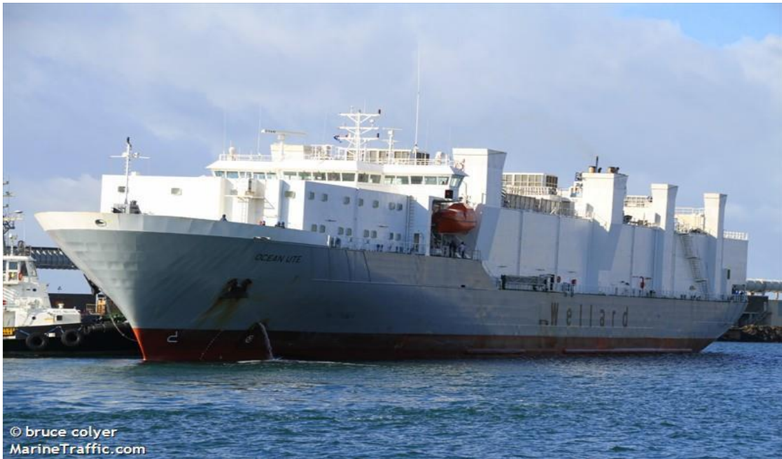
Slika 6. M/V Ocean Ute