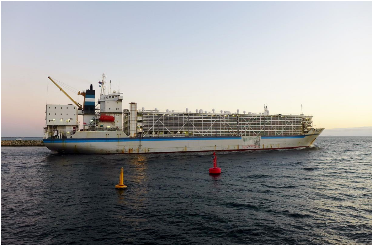
Slika 8. M/V Al-Shuwaikh

Kod otvorenog tipa brodova za prijevoz stoke sve ili većina štala za životinje su izgrađene na otvorenoj palubi ili palubama. U teoriji takav dizajn omogućuje kontinuiranu ventilaciju štala i oslobađa brod od potrebe korištenja mehaničke ventilacije. Međutim u praksi prirodna ventilacija sama, nije dovoljna i adekvatna u svim situacijama i meteorološkim uvjetima. Dobar primjer je slučaj kada vjetar puše u smjeru broskog kursa istom i približnom brzinom što stvara dojam da vjetra uopće nema i rezultira u nedostatku ventilacije. Stoga je i na ovakvim brodovima uobičajena praksa ugradnja nekih ventilacijskih uređaja na kritičnim područjima brodskih paluba. Na slici 8. je brod otvorenog tipa Al-Shuwaikh.