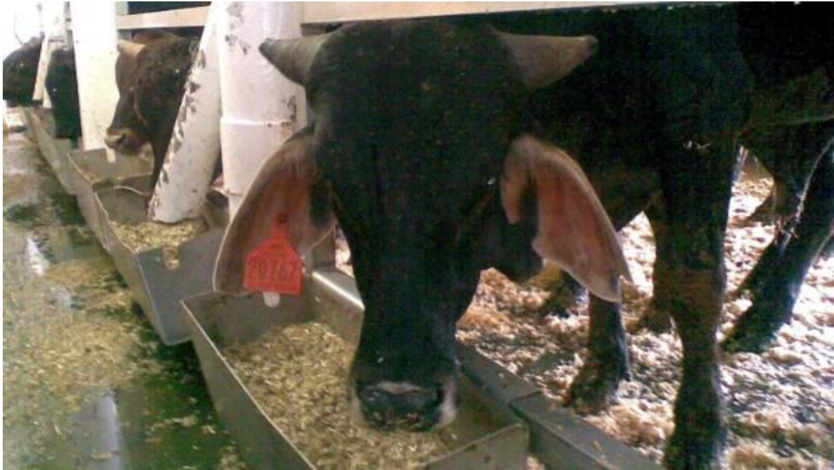
Slika 14. Aluminijske pojilice za hranu

Pojilice za životinje su aluminijske posude pravokutastog oblika koje se postavljaju na već spomenute aluminijske pregrade kojima se omeđuju štale.