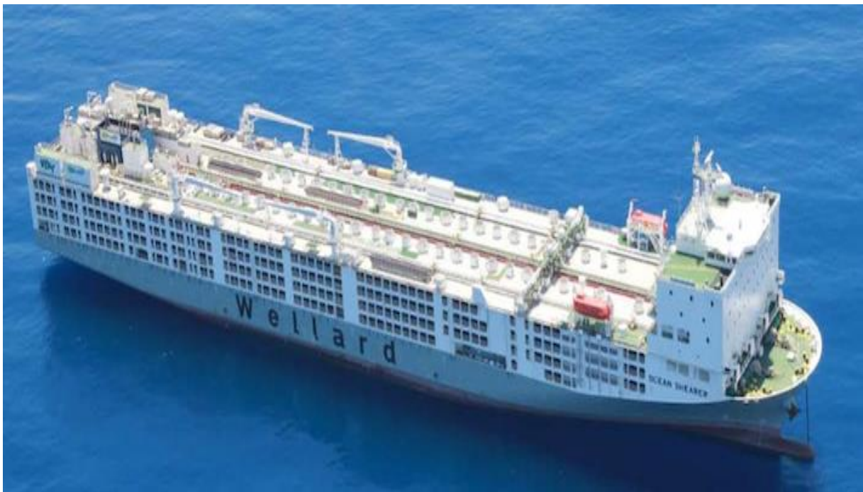
Slika 5. M/V Ocean Shearer (novi)

https://maritimequote.nl/wp-content/uploads/2017/06/Ocean-Shearer.png