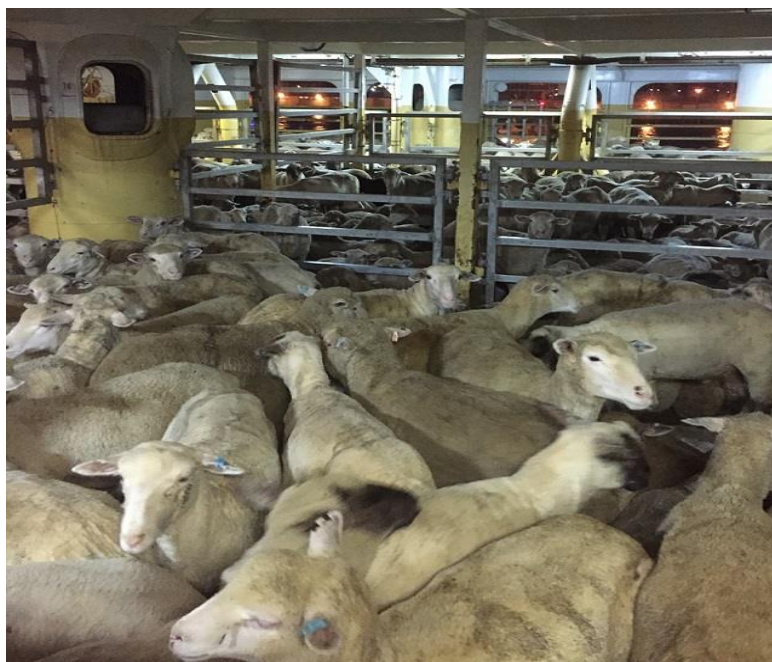
Slika 12. Ovce smještenu u jednu od brodskih paluba

Da bi se dopremile bale sijena, piljevine i druge potrepštine od vrha najgornje palube do palube broj 6 se nalazi vertikalni otvor kroz koji se dizalicom spuštaju te stvari, te ih dalje posada raspodjeljuje po ostalim palubama.