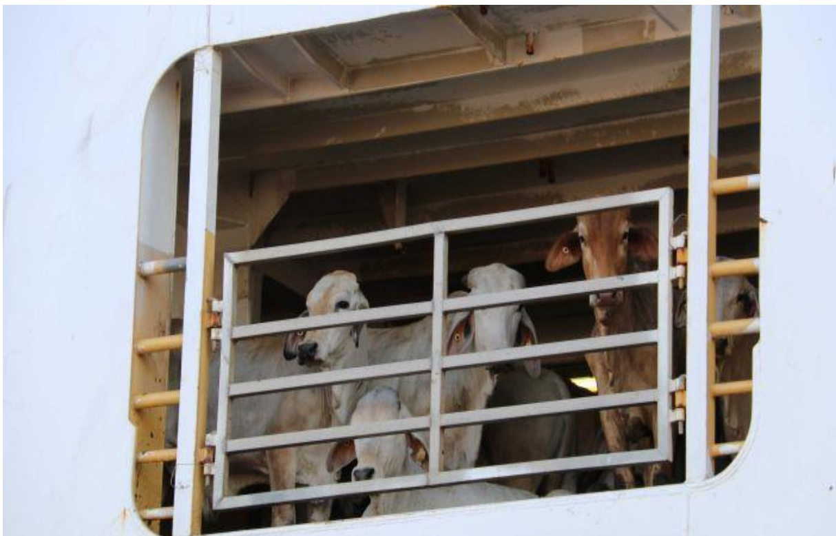
Slika 11. Aluminijska pregrada s vanjske strane broda

Na slici 11. se vidi jedna od aluminijskih pregrada s vanjske strane broda, koja se po potrebi može dići. Ovakve pregrade se nalaze unutar svake brodske palube i njima su omeđene štale.