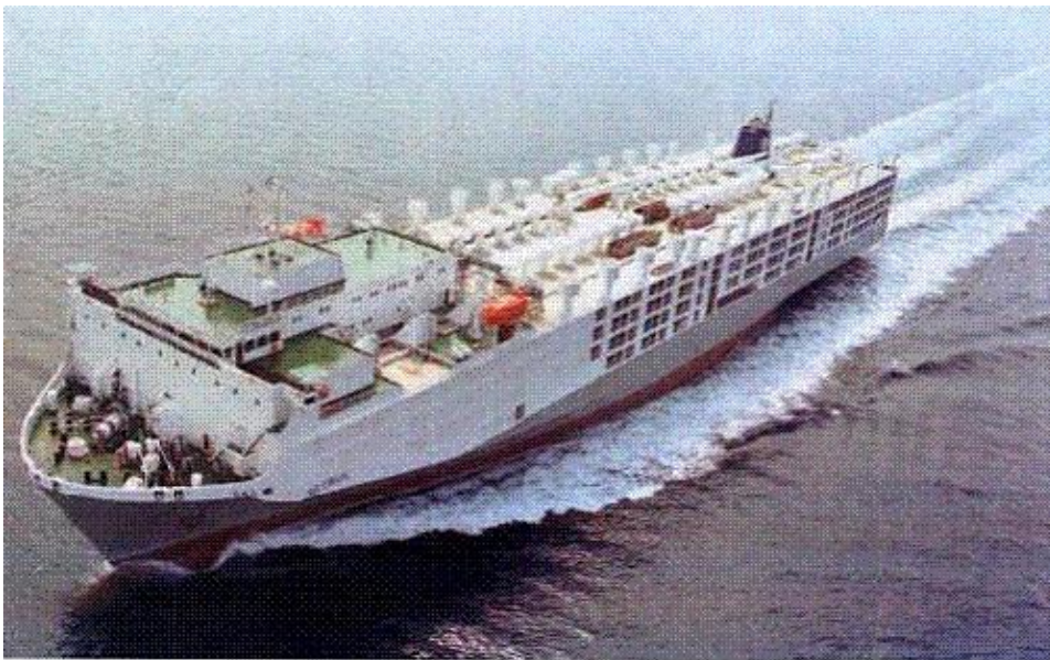
Slika 13. Pogled na sun deck Ocean Drovera

Ocean Drover je opremljen ventilacijskim uređajima koji imaju ventilacijsku učinkovitost od preko 100 promjena zraka u jednom satu. Na prethodnoj slici 12. se može vidjeti jedan takav ventilacijski otvor između brodskih štala. Takvih ventilacijskih „stupova“ okruglog oblika na brodu ima oko 100 i protežu se od prve, najdonje brodske palube do najgornje palube na kojoj se nalaze ventilacijski uređaji pokriveni metalnim pokrovima koji izgledom podsjećaju na gljive. Neki uređaji služe za upuhivanje svježeg zraka u štale, a neki za izbacivanje kontaminiranog zraka van. Na slici 13. na sun decku Ocean Drovera možemo vidjeti ventilacijske uređaje pokrivenne metalnim pokrovima za zaštitu od loših vremenskih uvjeta, ali usprkos tome oni zahtijevaju kvalitetno održavanje.