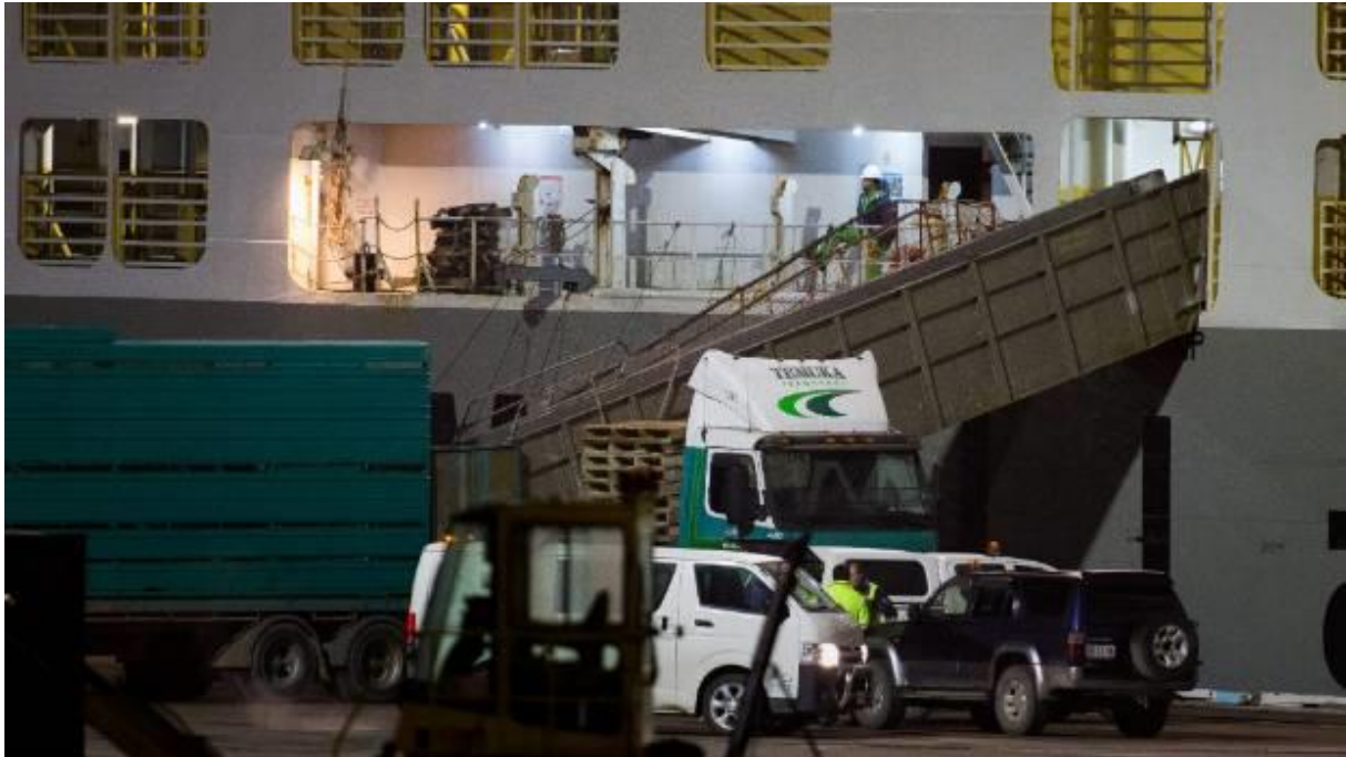
Slika 18. Ukrcajna rampa

Na slici 18. vidimo ukrcajnu rampu koja je spojena na glavnu, šestu palubu, preko koje posada dalje raspodjeljuje životinje u suradnji sa krcateljem ovisno o ukrcajnom planu.