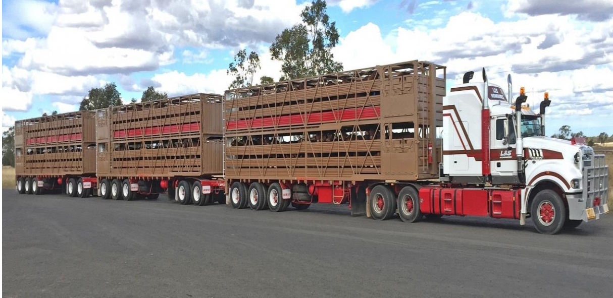
Slika 19. Kamion sa 3 prikolice

Iz ovoga možemo zaključiti da ukrcaj ide vrlo brzo i traje jako kratko, pa je tako naprimjer za ukrcaj od 15.000 grla uobičajeno da traje 2 dana.