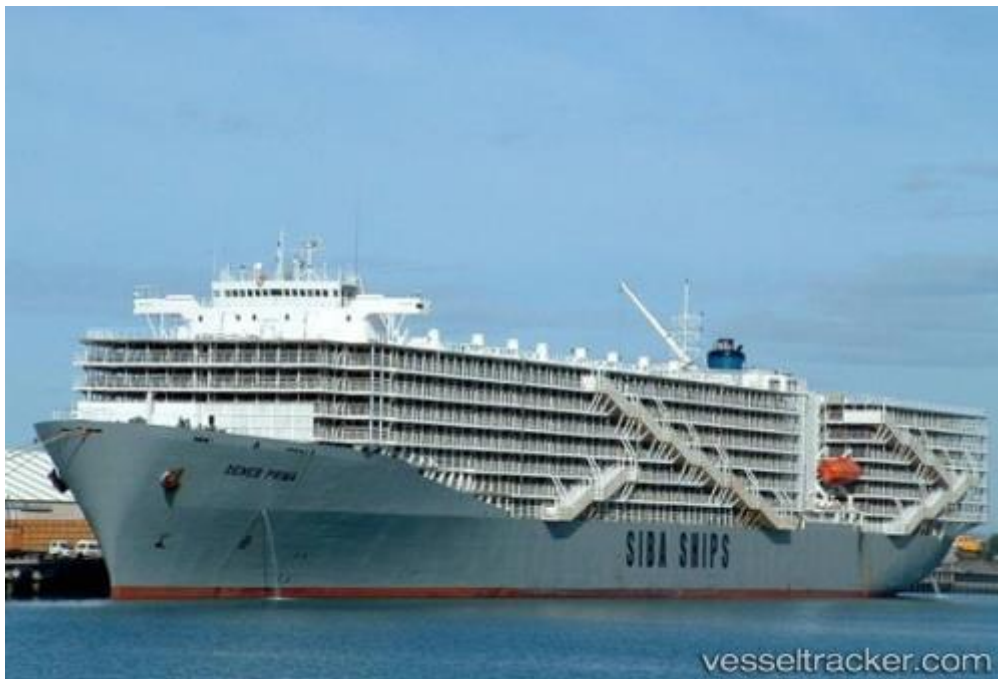
Slika 4. M/V Ocean Shearer ( stari )

Rad na ovakvim brodovima je vrlo zahtjevan za posadu, pa je nerijetka praksa nagrađivanje posade novčanim bonusima od strane kompanije ovisno o uspješnosti putovanja. Životinje kao teret zahtijevaju puno pažnje i brige tokom plovidbe što zahtjeva i veći broj članova posade palube zbog opsega posla, pa stoga ovakvi brodovi imaju preko četrdeset članova posade, što je dvostruko više od drugih vrsta teretnih brodova. Na slici 4. prikazan je stari Ocean Shearer, prenamijenjeni kontejnerski brod, nekoć najveći brod za prijevoz stoke na svijetu prije nego je završio u rezalištu.