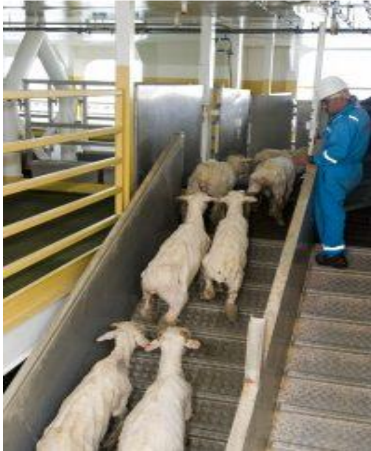
Slika 20. Ukrcaj preko palubne rampe