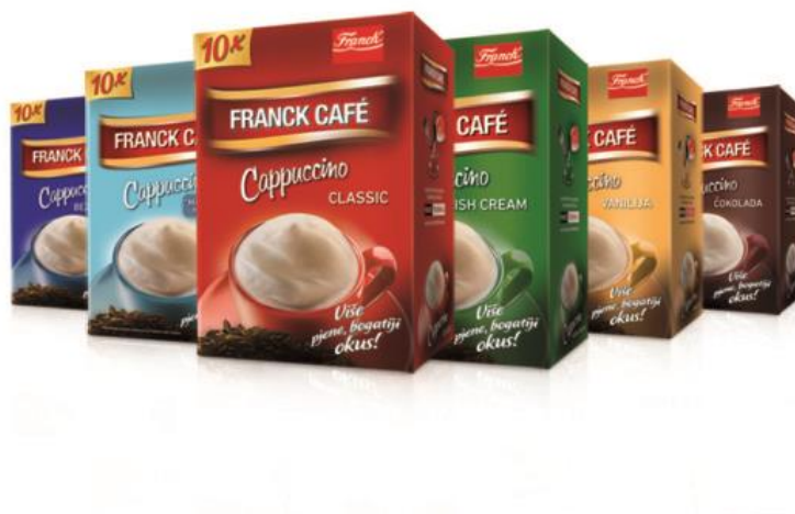
Slika 9. Franck proizvod

Franck uz kavu, čajeve i snack proizvode, nudi iznimno široku paletu proizvoda: kavovine, prilozi jelima, začini jelima, šećeri, proizvodi za pripremu kolača i praškasti proizvodi.