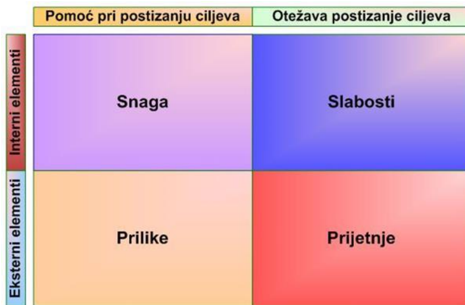
Slika 5. SWOT matrica