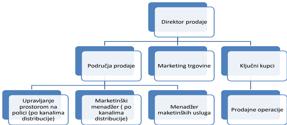
Slika 1. Organizacijska struktura trade marketing funkcije