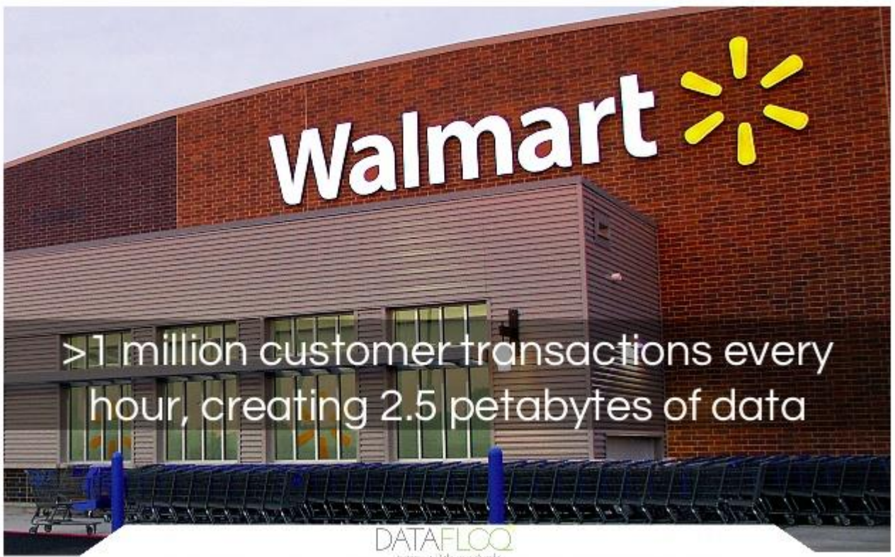
Slika 3: Data Cafe Walmarta

Uvođenjem Data Cafe omogućeno je umetanje podataka na nevjerojatnu brzinu od 3 milijuna redaka u minuti. Ova vrsta unosa podataka može lako upravljati količinama korisničkih podataka čak i na najprometnijim danima kupovine, kao što je crni petak. Brza analiza takvih ogromnih podataka omogućila je Walmartovim zaposlenicima da u realnom vremenu reagiraju na izazove kao i kada su nastali. Data Cafe Walmarta vidljiva je na slici 3.