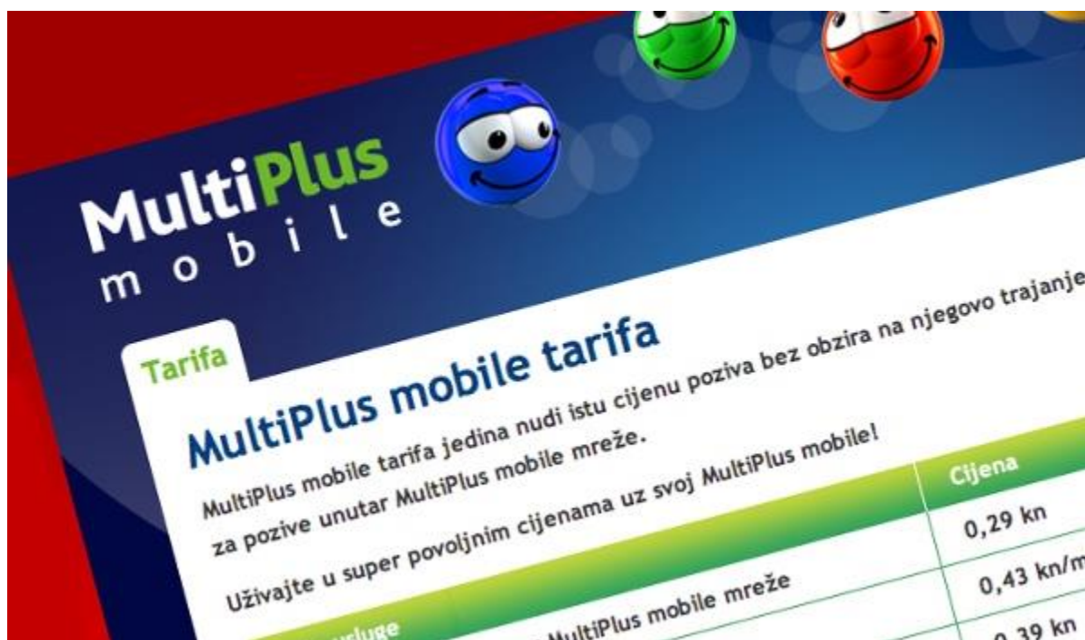
Slika 6: Primjer Multi plus Card-a