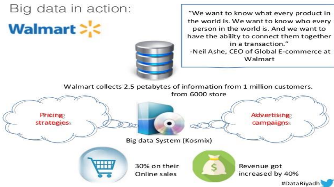
Slika 2: Big data u Walmart-u

podataka kako bi predvidio njihove potrebe, a zatim kreirao personalizirane mobilne ponude za povratne kupce što može biti slučaj kod slike 1 i slike 2.