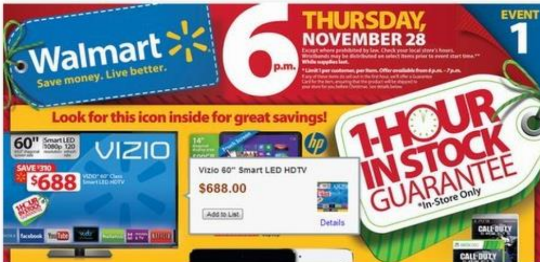
Slika 1: Primjer prikaza oglašavanja preko mobilnih aplikacija – upečatljivost proizvoda

usklađeni s njihovim iskustvima, a ne na televiziji, pri čemu potrošači vjerojatno napuštaju prostoriju ili brzo napreduju tijekom komercijalnih aktivnosti. Svoje proizvode oglašavaju preko mobilnih aplikacija tako što ističu cijene za proizvode koji se odnose na sve dobne skupine. Navedeno se može vidjeti na slici 1.